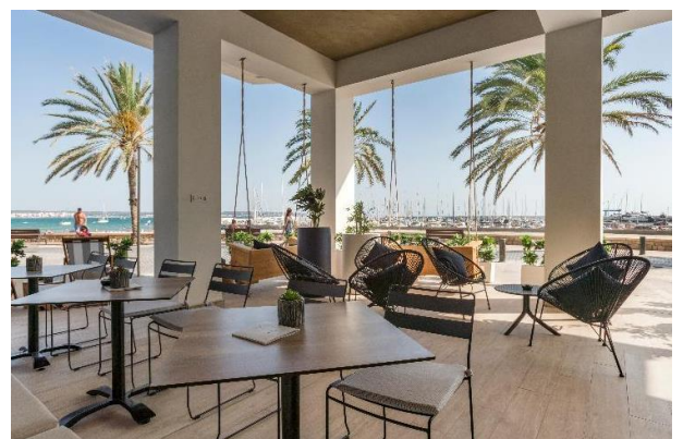
Utsikt från hotellets terrass

I priset ingår transfer Västerås – Arlanda t/r, flyg t/r, 7 övernattningar med del i dubbelrum, 7 frukostar, 6 middagar på hotellet inklusive 1 glas vin, 1 middag på restaurang dag 7, 4 utflykter inklusive luncher enligt program, 1 utflykt till Sineu marknad, 1 utflykt till Drakgrottorna, inträde till katedralen La Seu samt whispers. Med på resan finns också vår reseledare som genom sin yrkesmässiga kunskap bidrar till guidning, service och trygghet.