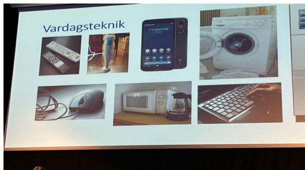
Exempel på vardagsteknik

Ett av instrumenten: 'Rådgivning och förskrivning av teknik' kan användas av arbetsterapeuten utan speciell utbildning. Efter utredningen kan arbetsterapeuten stödja personen i användandet av tekniken i vardagen.