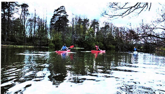
Kajakuthyrning i Harg