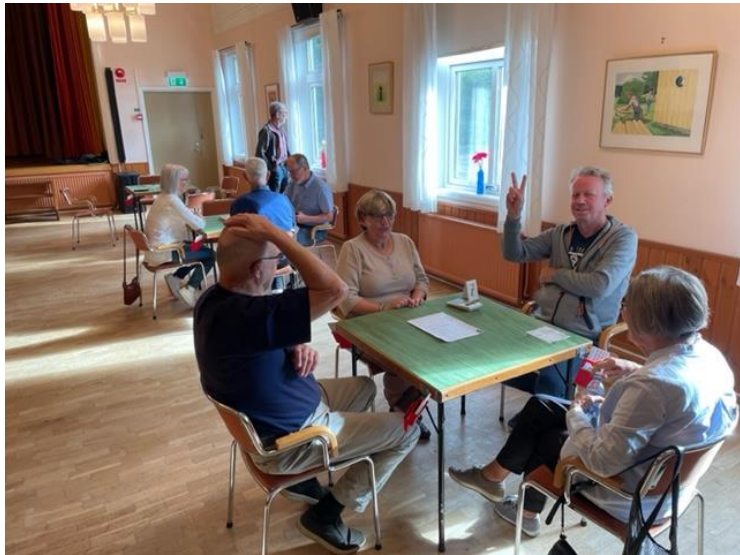
Samling vid borden inför spelstarten