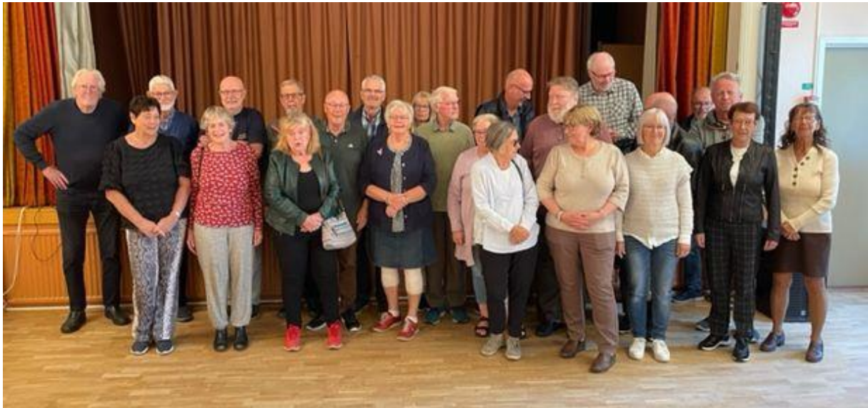
Samling av spelarna inför besked om slutresultatet