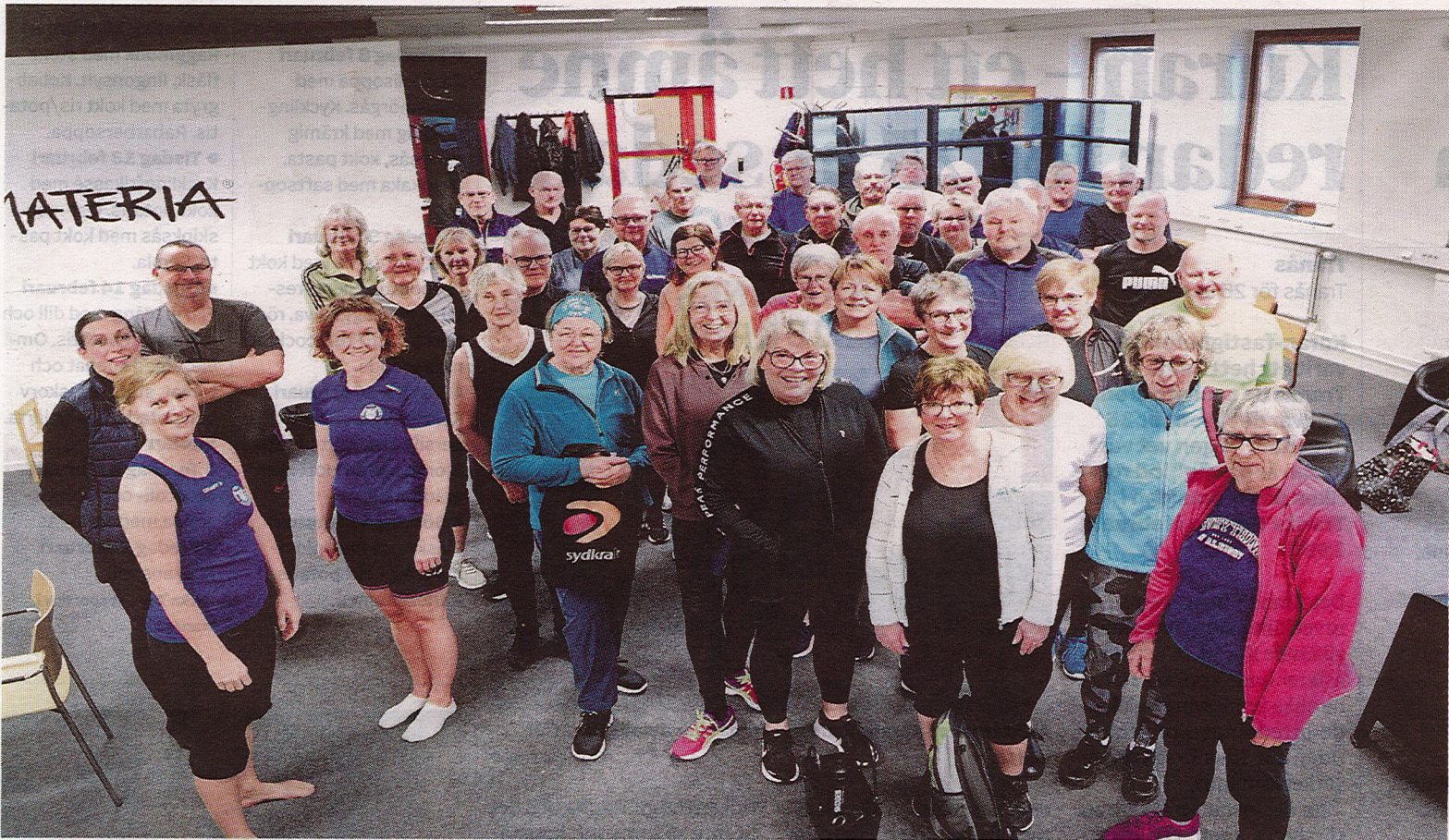
Idrottsskolan 65+ är en stor succé med 50 anmälda deltagare. Här är deltagarna i förra veckans träning samlade med ledare från Tranås gymnastik- sällskap och arrangörer från kultur och fritid och RF Sisu Småland.