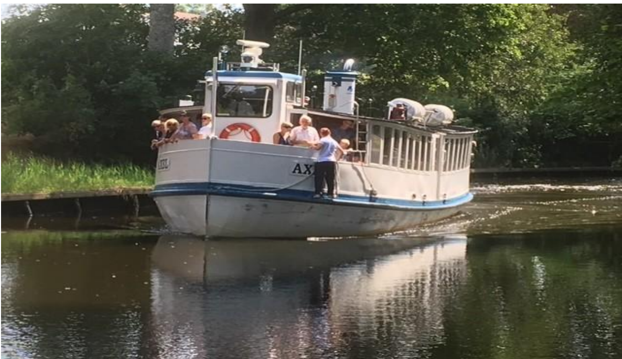
Nättrabybåten Axel redo att anlöpa Nättabyhamn