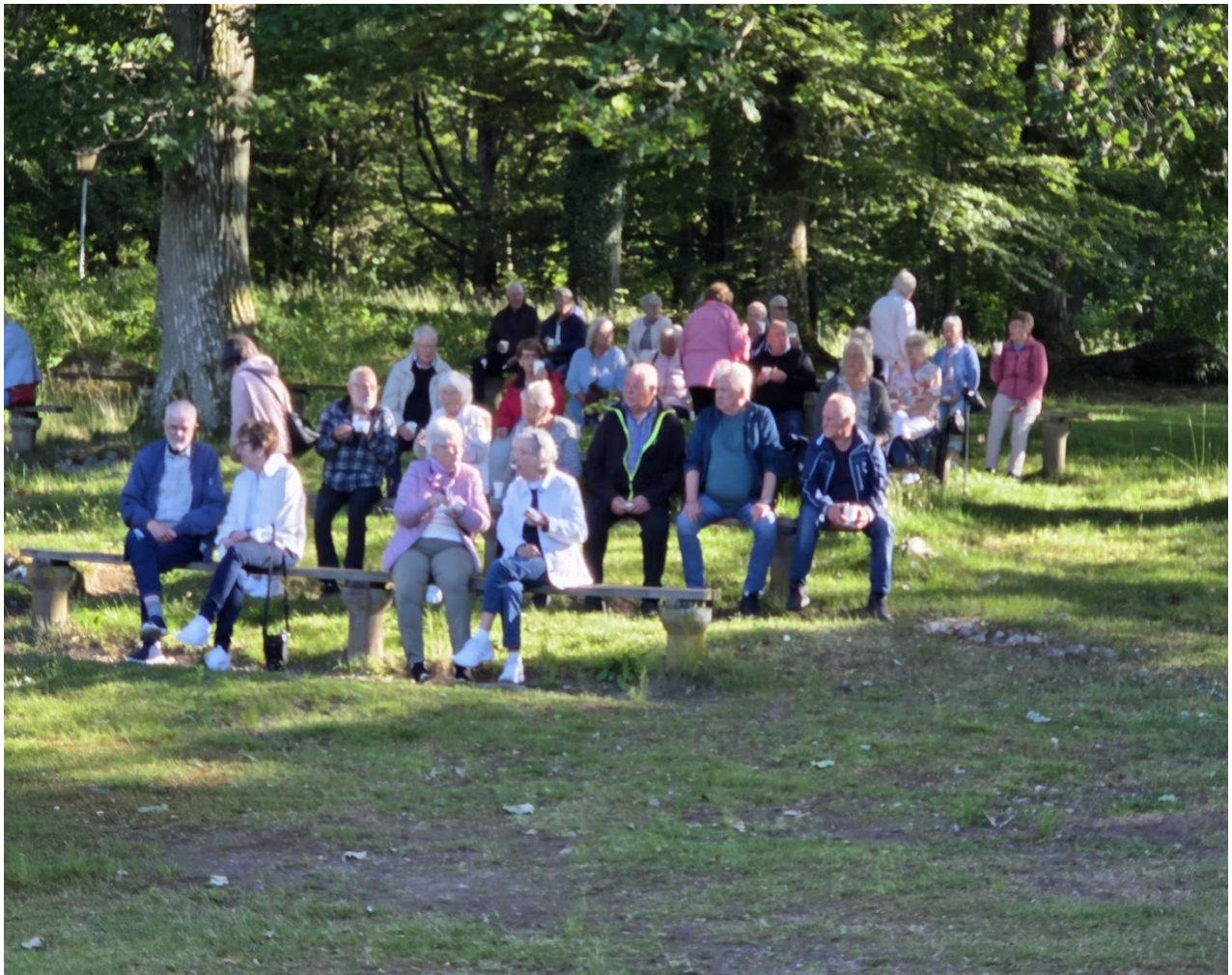
Allsång i Hoby Ekbacke

Genom ett samarrangemang SPF och PRO genomfördes ett dialogmöte 25-12-01 med Regionstyrelsens ordförande på Hotel Fritza. Frågor som diskuterades var det Nya systemet Cosmic, Resebevis/Sjukresor, Jourcentralen Karlshamn och Primärvården.