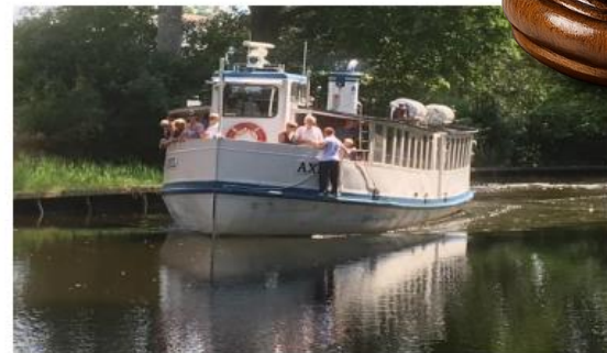
Nättrabybåten Axel redo att anlöpa Nättabyhamn