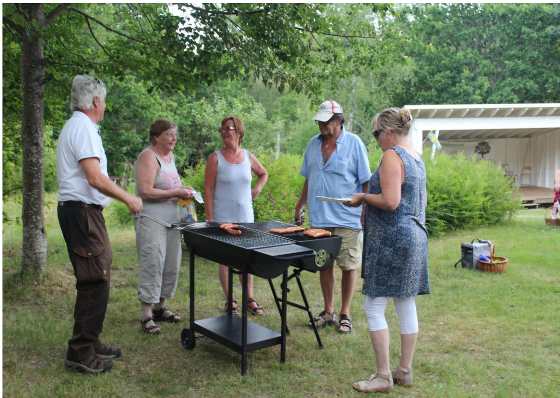
Corona-aktivitet i det fria, SPF Eringsboda-Tving