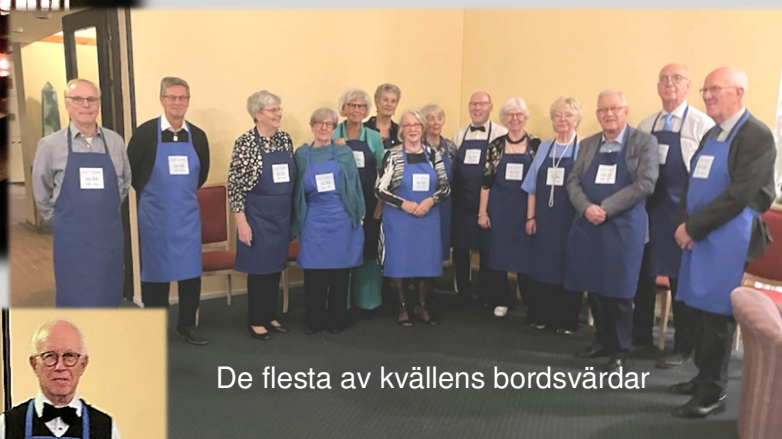
De flesta av kvällens bordsvärdar