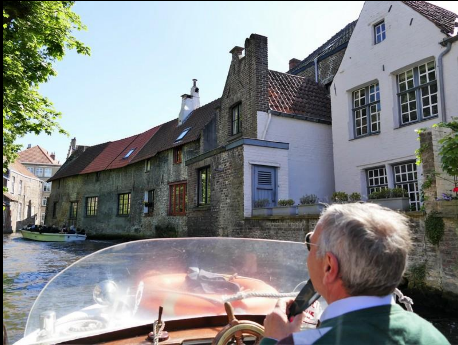
Vår skeppare och guide