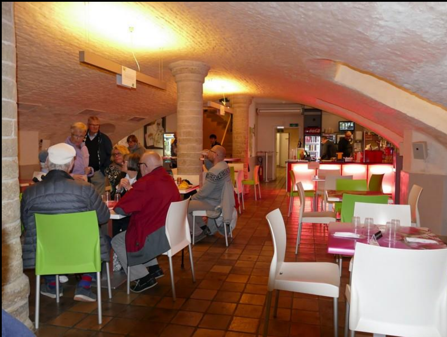
Vi äter pommis-frites med majonnäs.