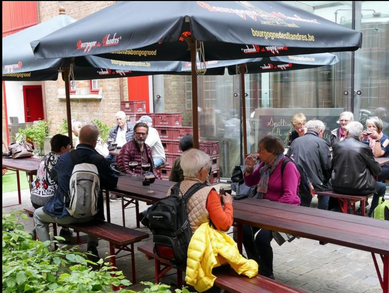
Ölprovning på bryggeriets gård efter visningen