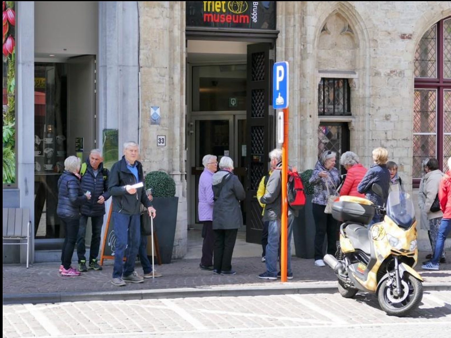
Väntan på att Pommefrites-museet ska öppna