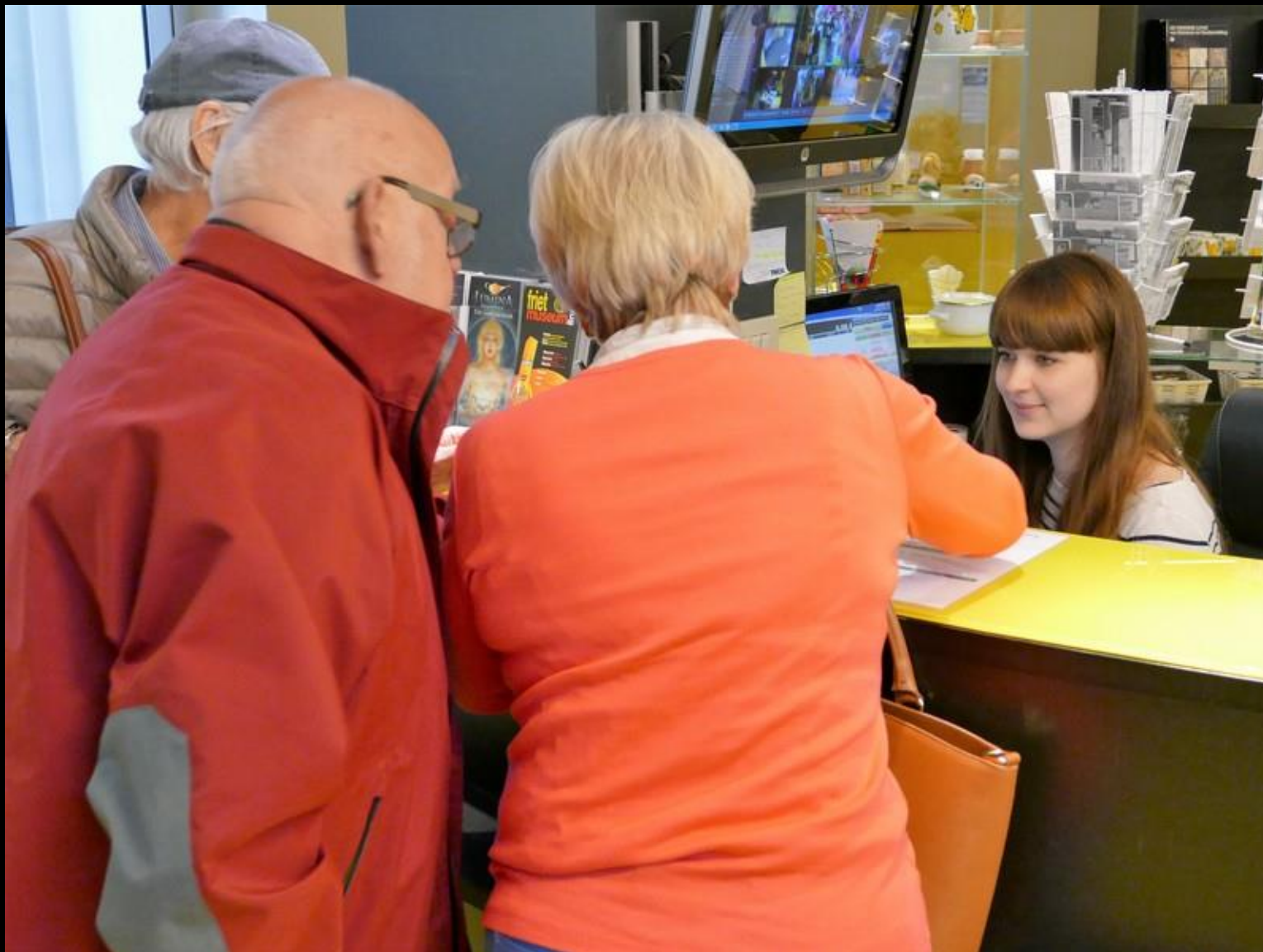
Pommes Frites-museets biljettkassa