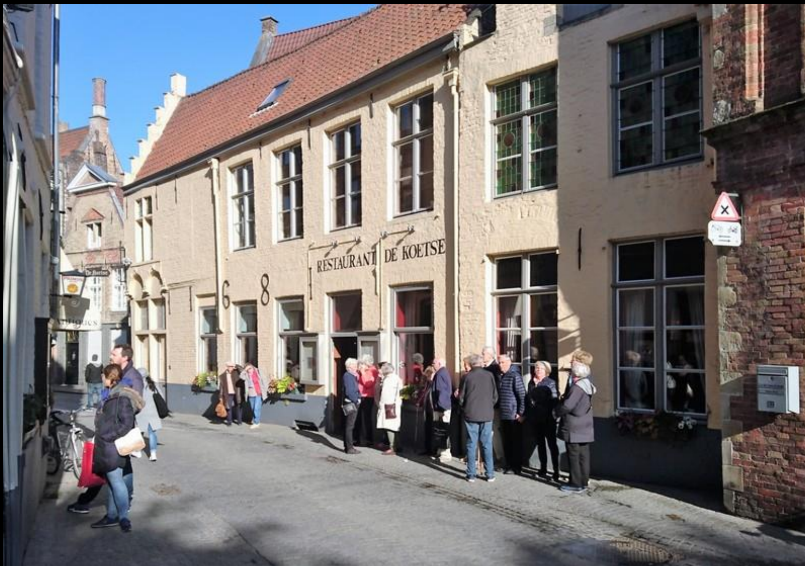
Dags att inta musslor med pommes frites