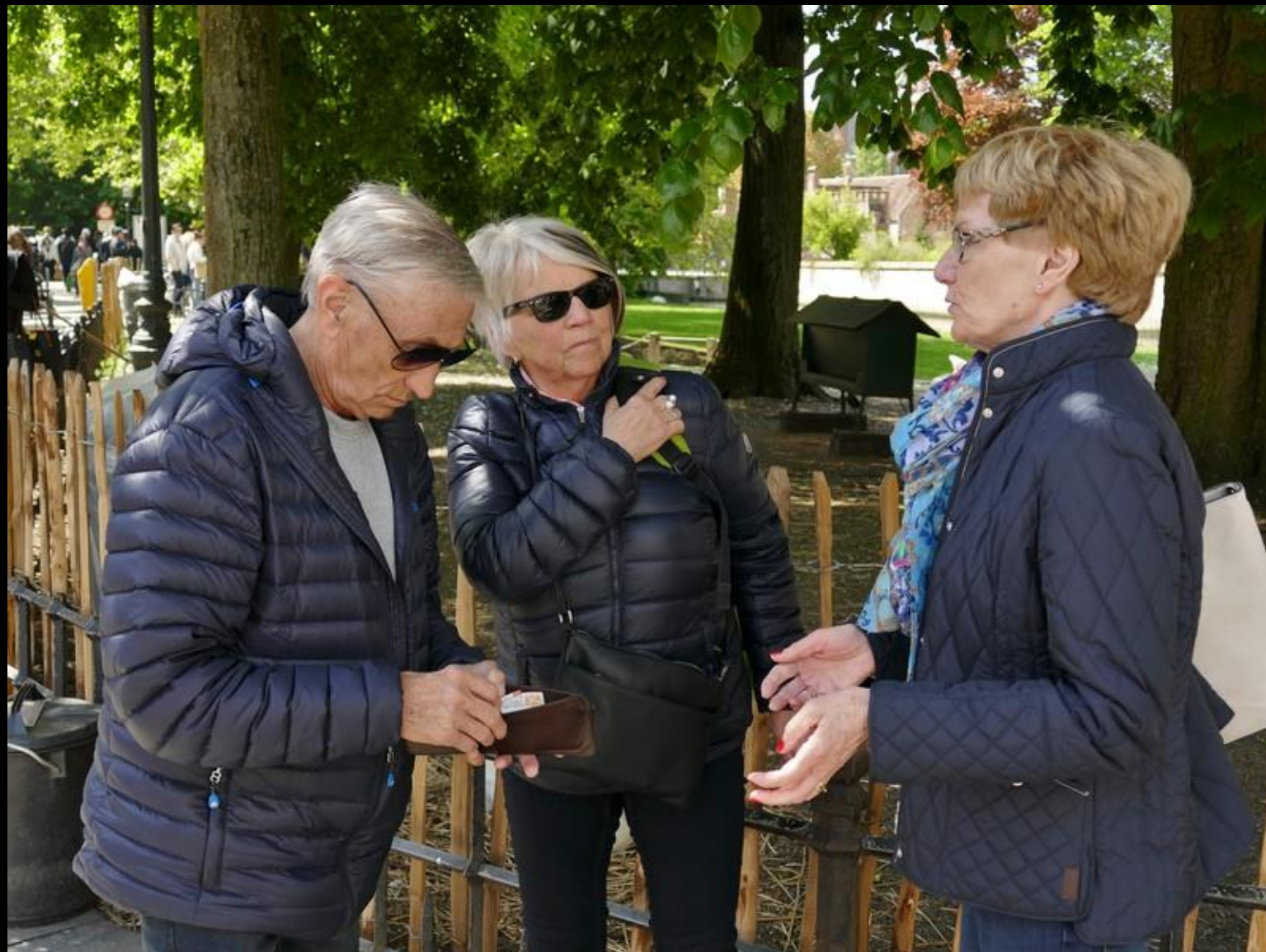
Snart dags att sitta upp i vagnen igen