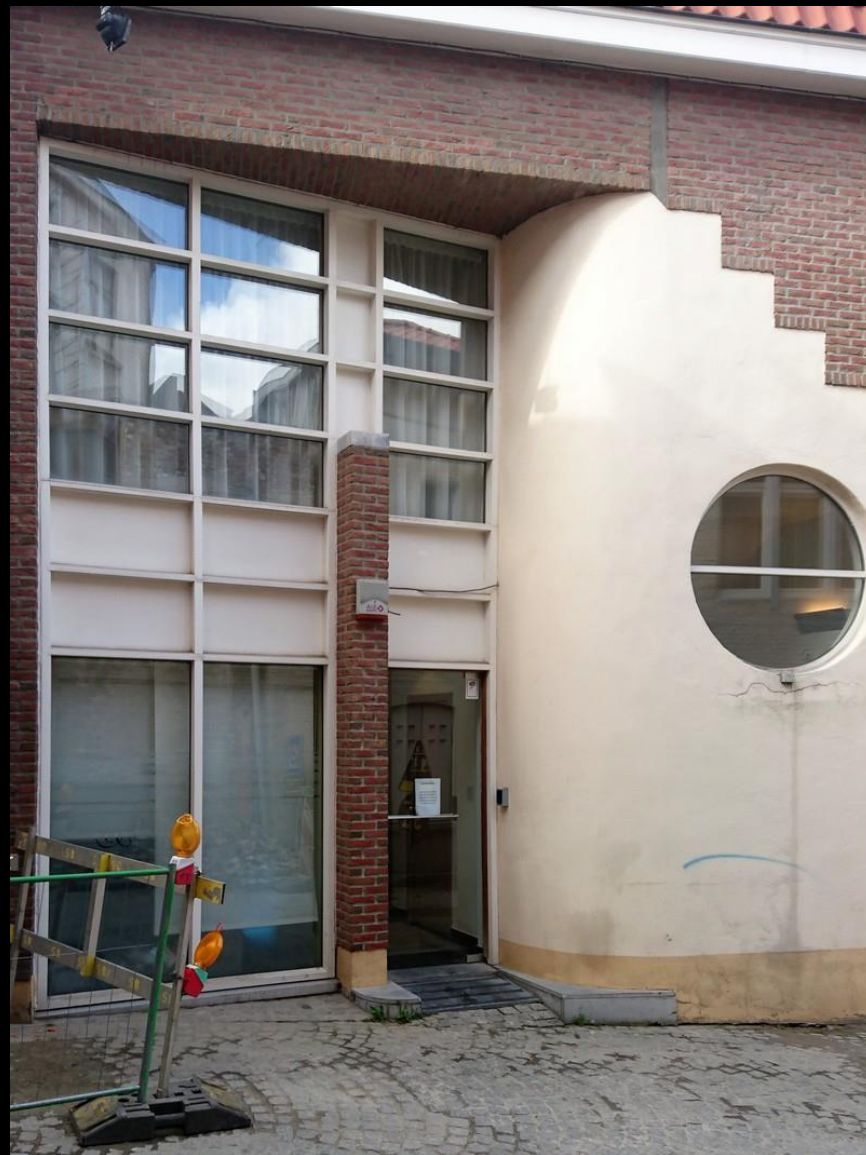
Ingång till hotellets annex