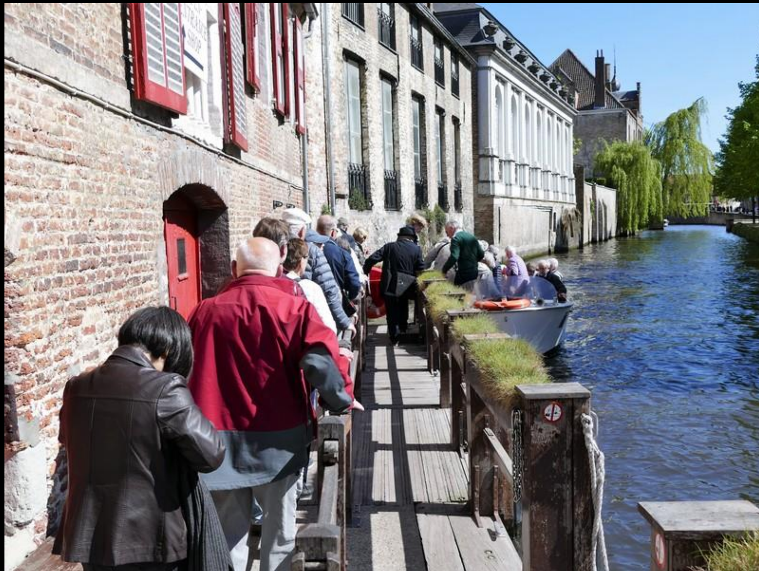
Vikingarna går ombord