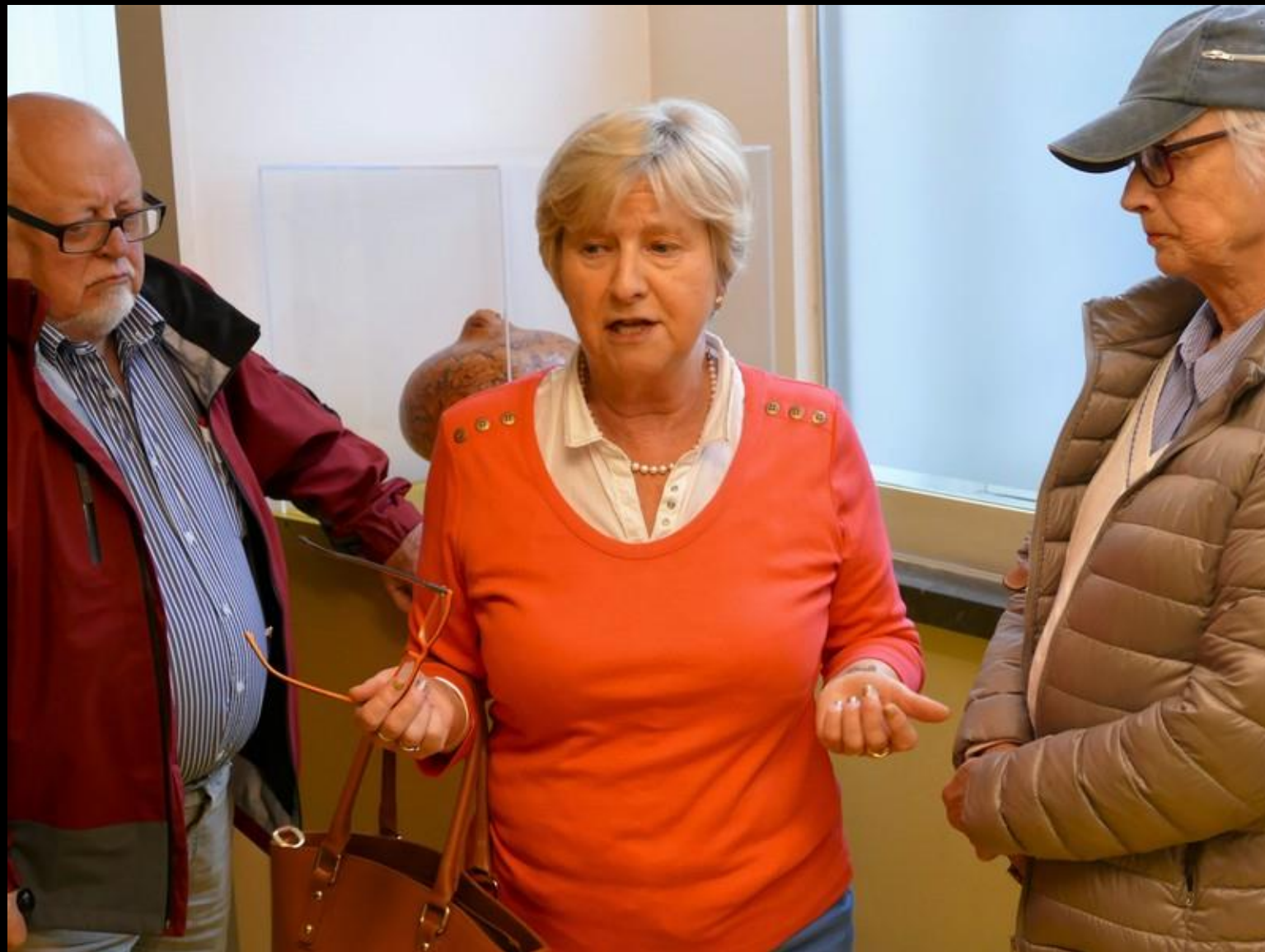
Vår kunniga potatisguide