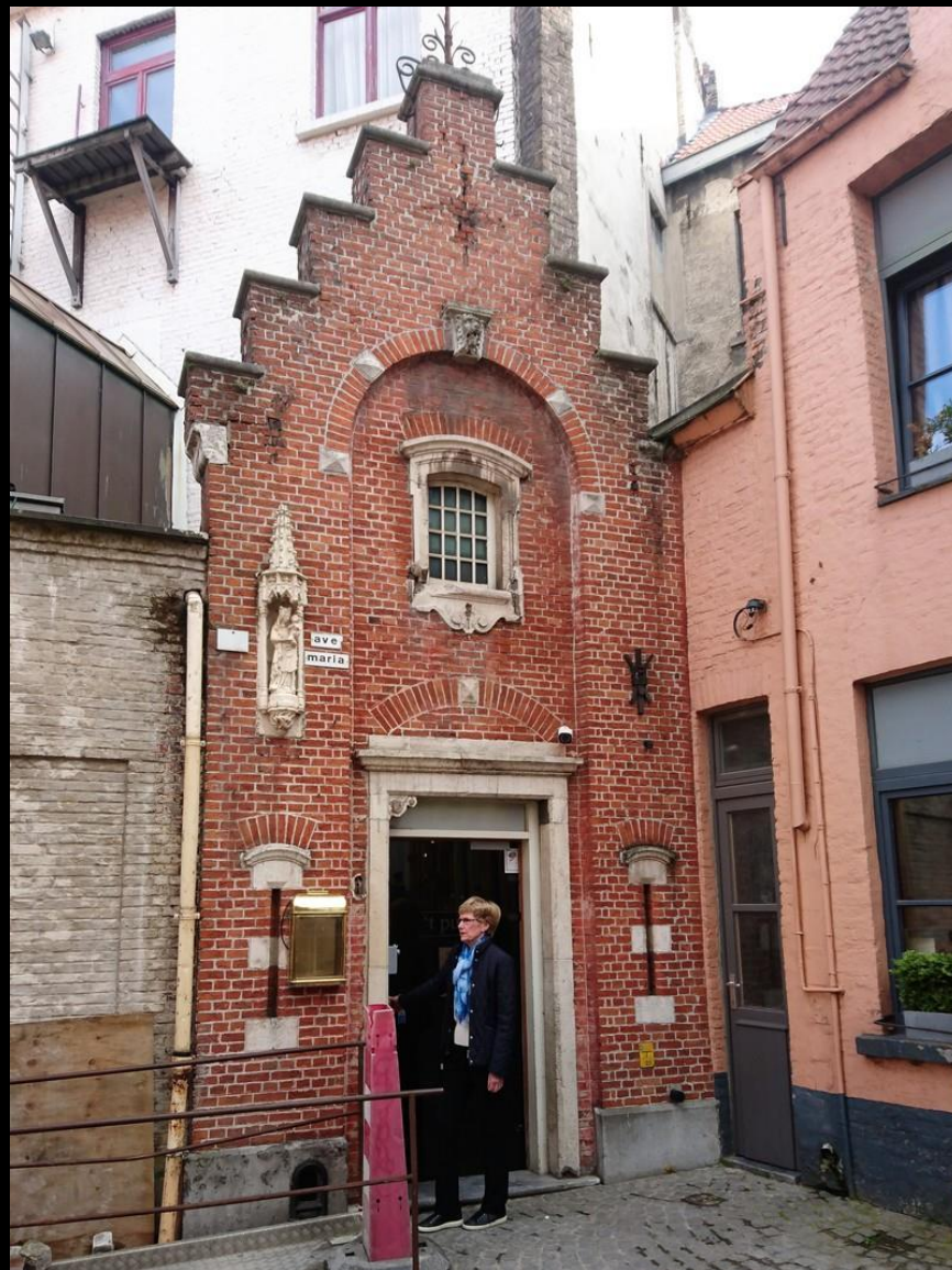
Entrén på hotellets baksida mot annexet