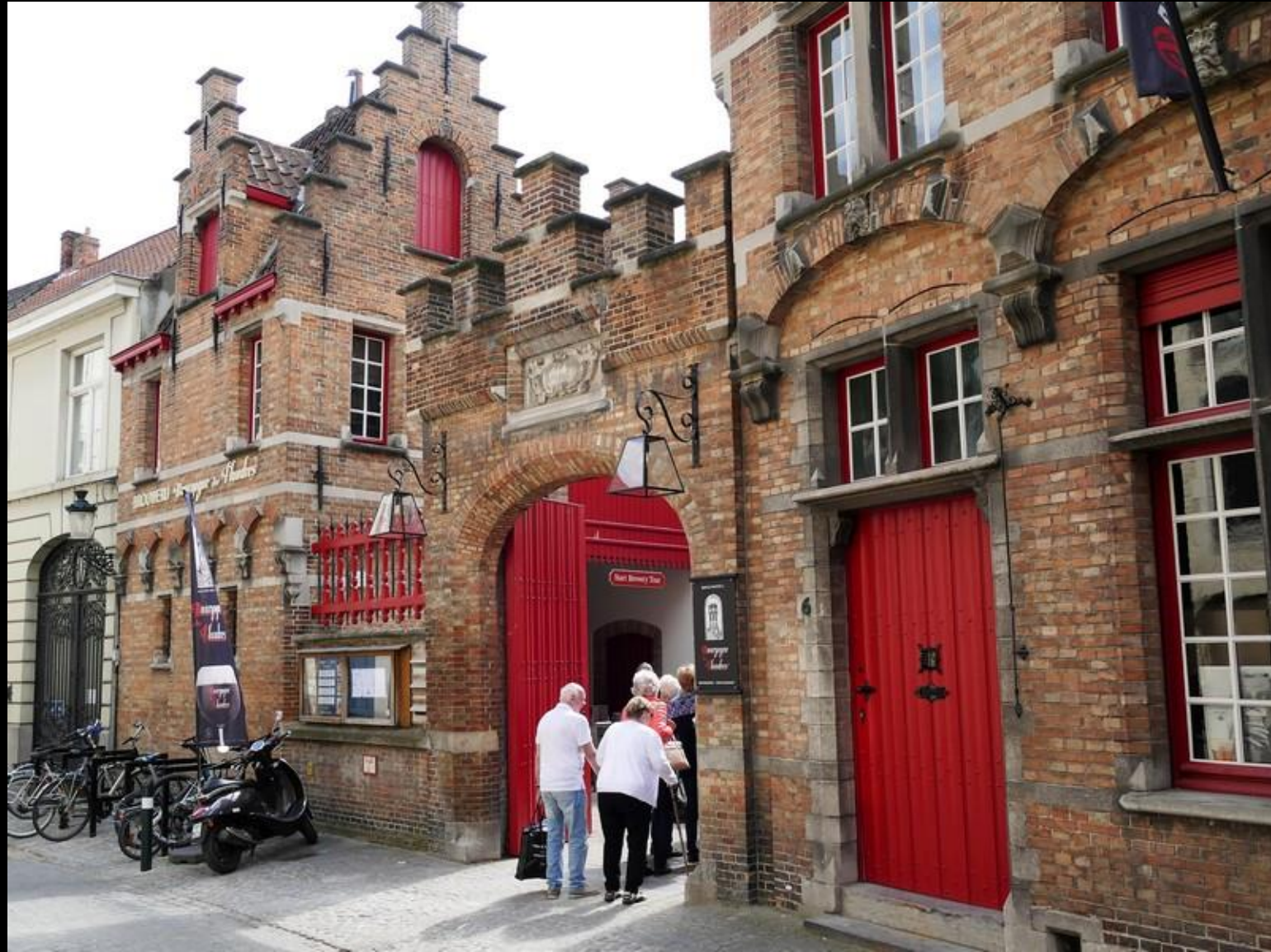
Studiebesök på bryggeri