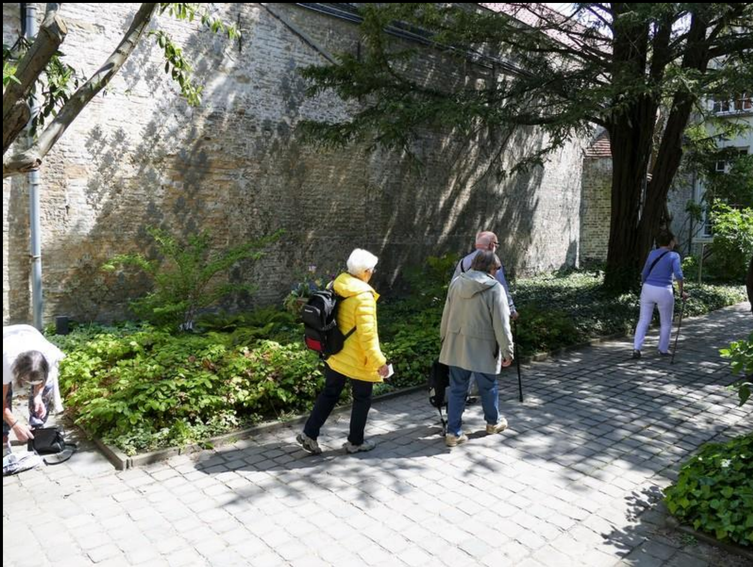
På väg in till ett konstmuseum