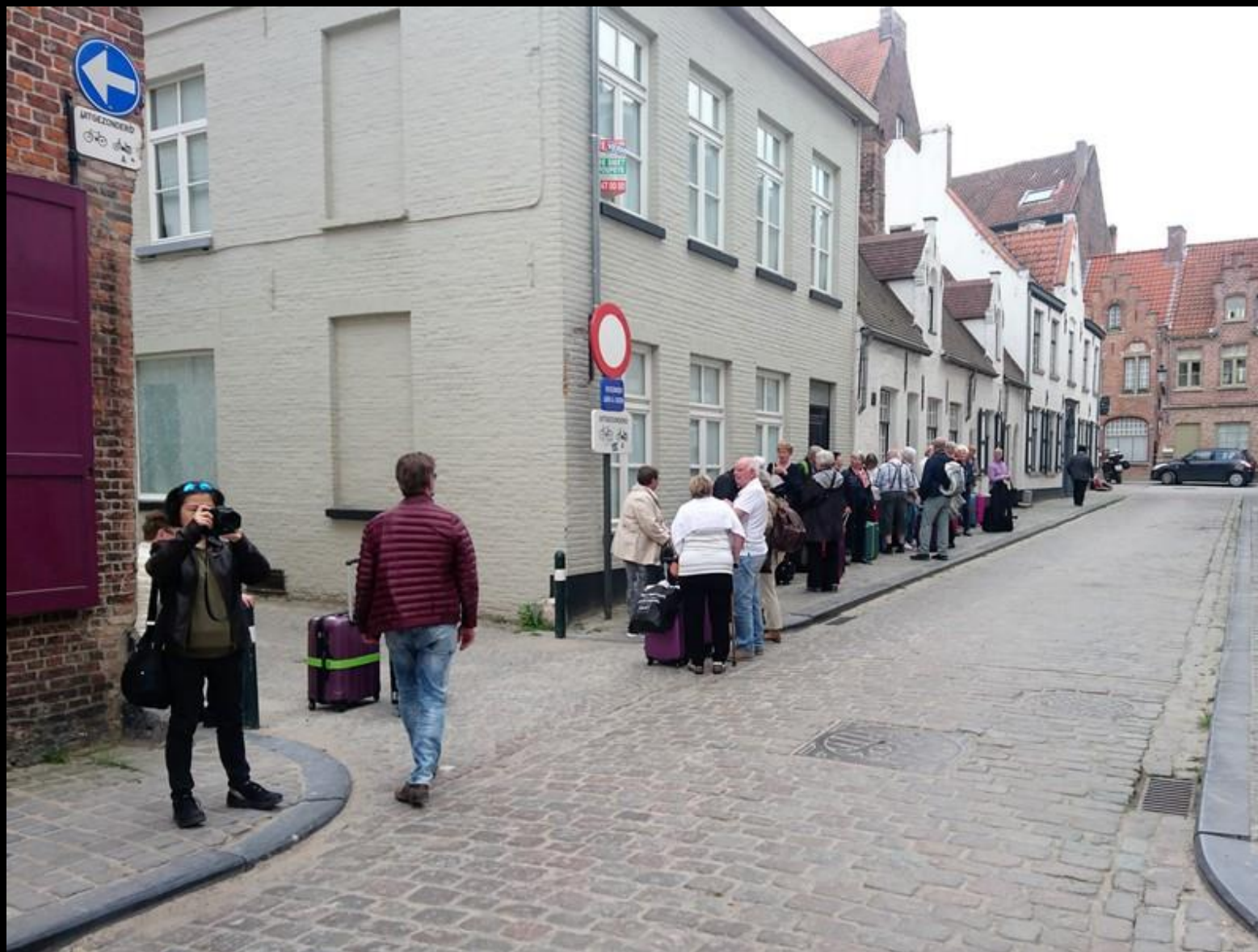
Dags för hemfärd