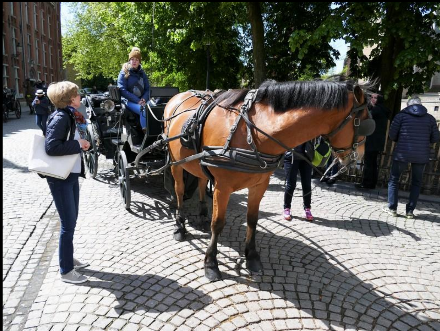
Fem minuters rast och utfordring av hästen