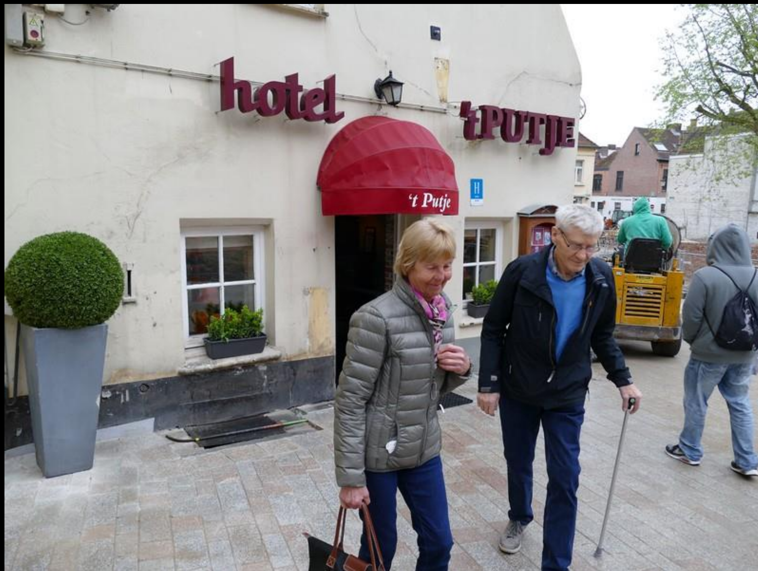
Huvudentrén till vårt hotell