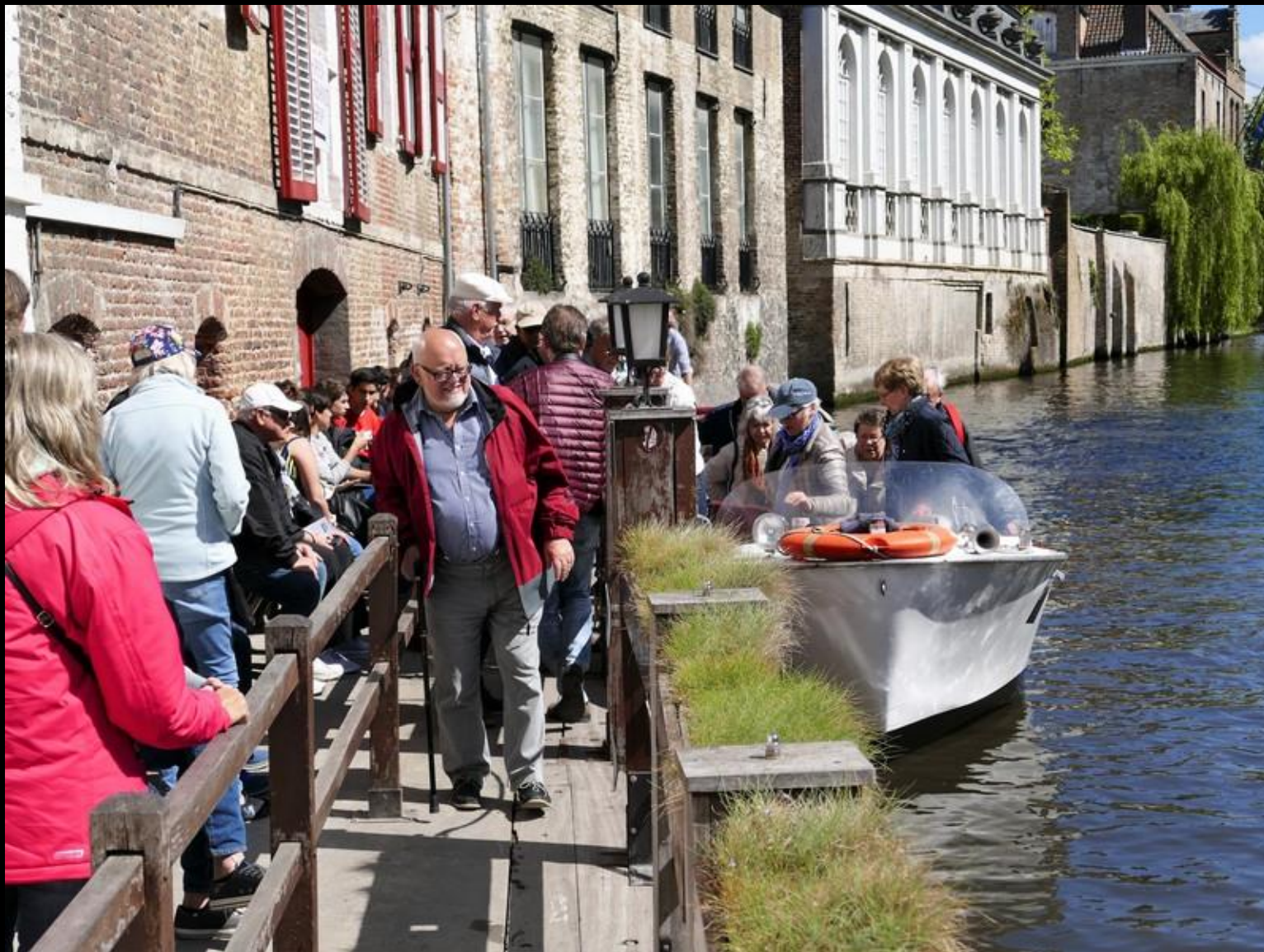
Vikingarna går i land