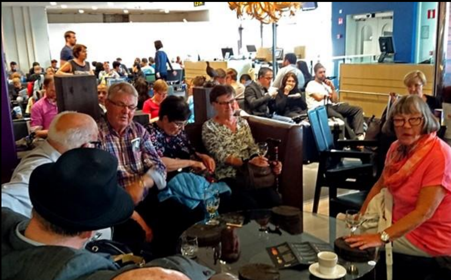
Väntan på Arlanda.