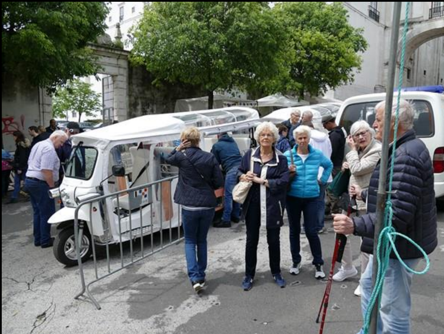
Framme vid Feira da Ladra (Tjuvarnas Marknad).