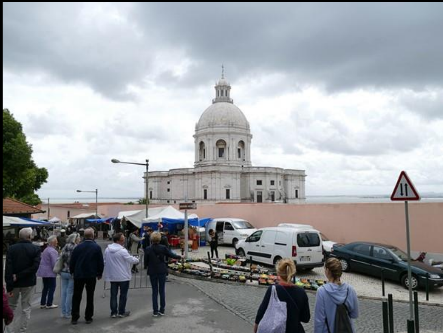
Begravningskyrkan National Pantheon i bakgrunden.