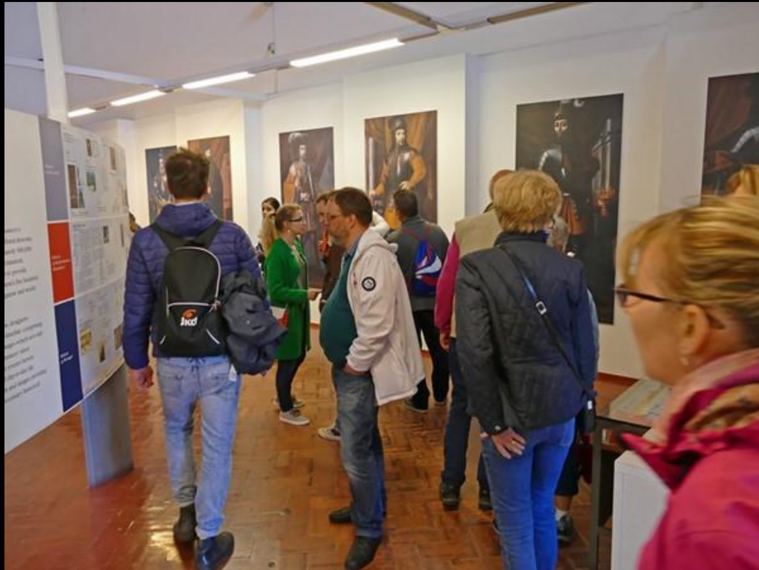
Utställning över klostrets historia.