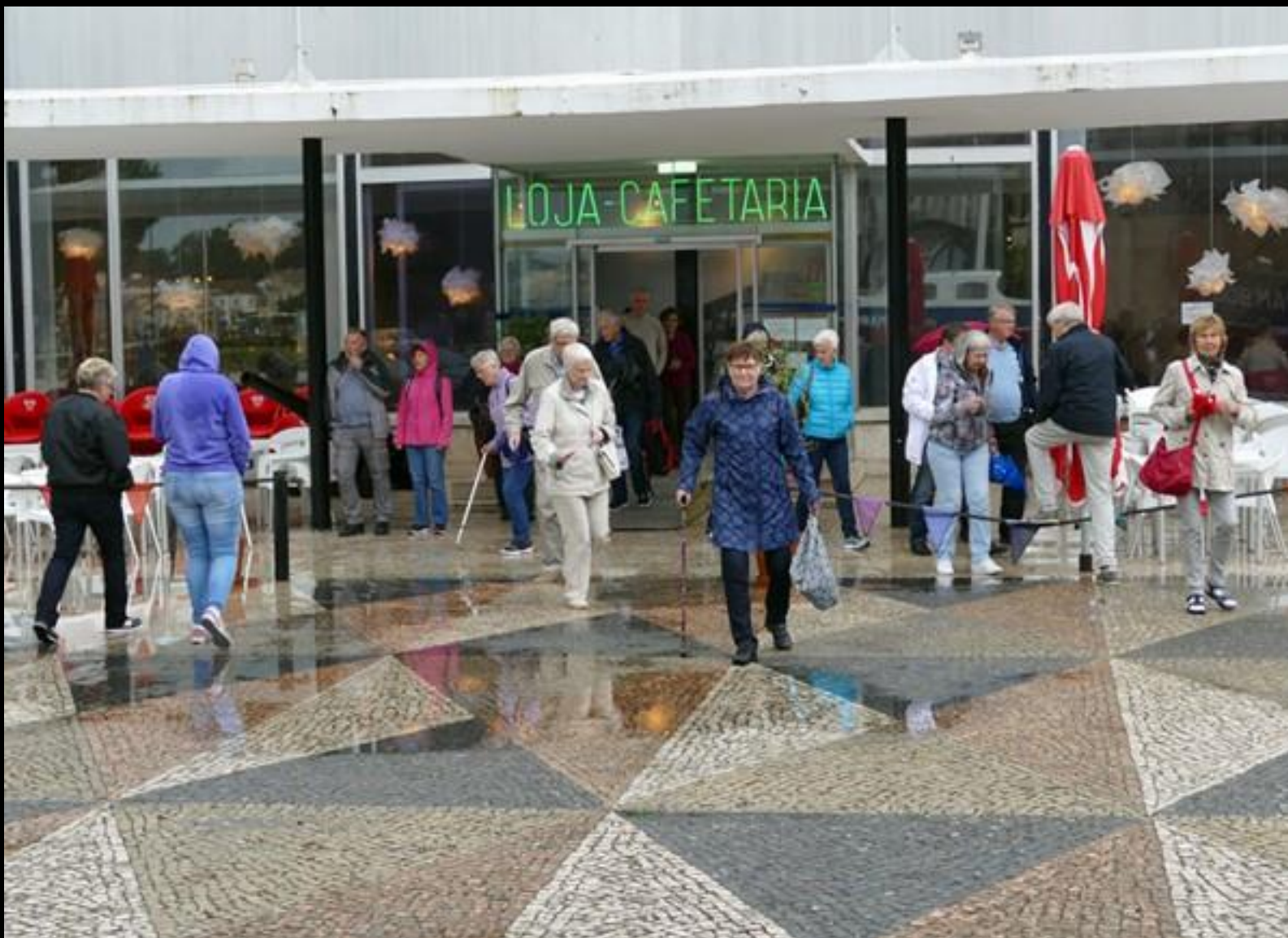
Färdiga för den religiösa aktiviteteten