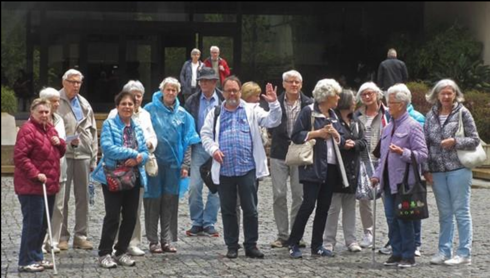
Utanför museet igen.