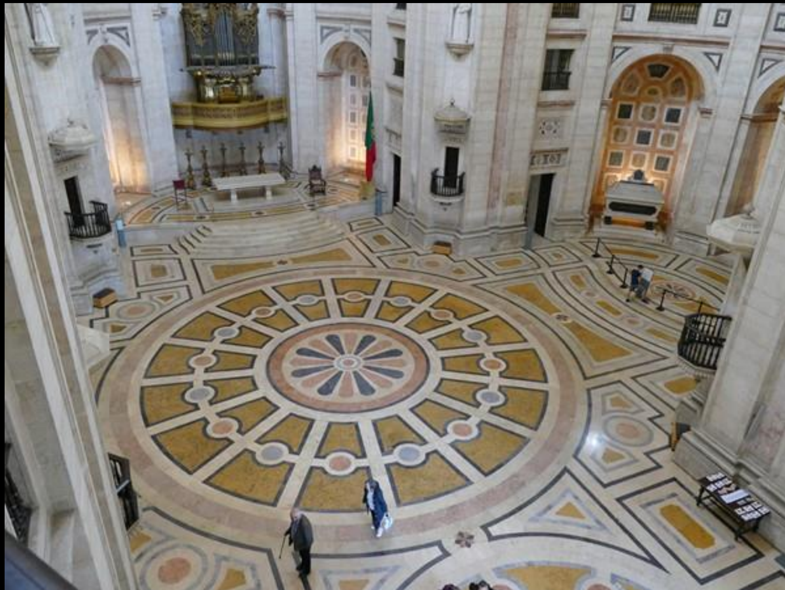
Undertecknad med hustru klättrar uppåt i kyrkan.