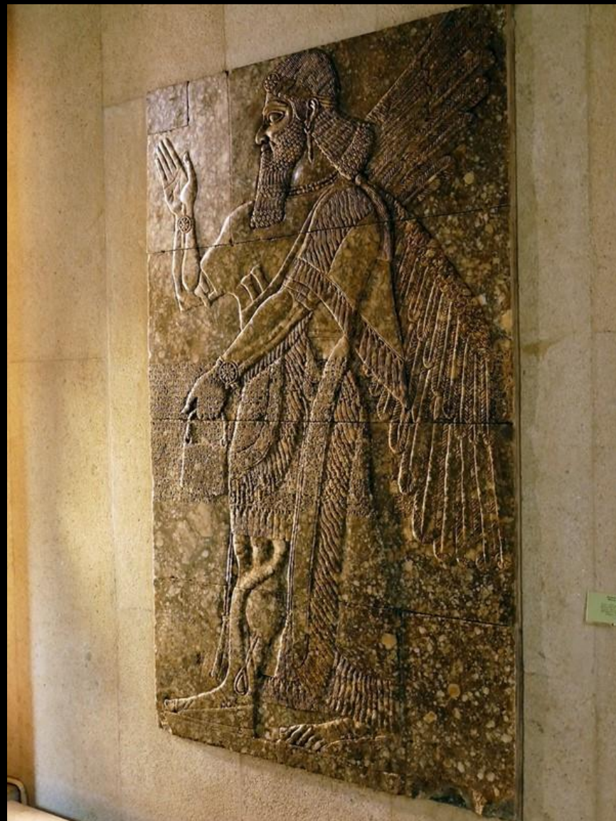
Bilder från Calouste Gulbenkian Museum.