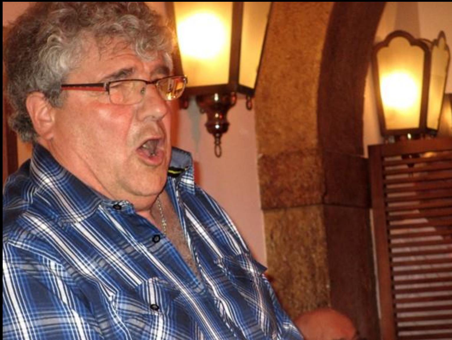
Gäst som sjunger Toreadorarian ur Carmen.