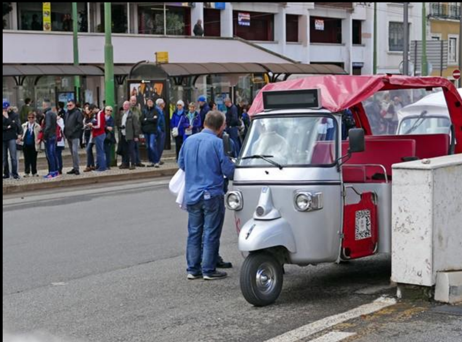
Vi tar Tuc-Tuc i stället och får privat guidning upp till Sehnora do Monte.