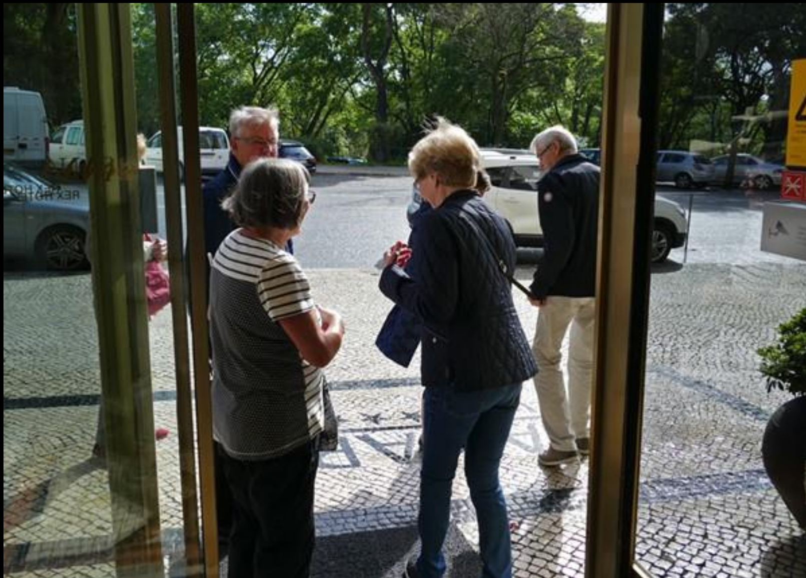
Tisag: Till Parca Martim Moniz med tunnelbana.