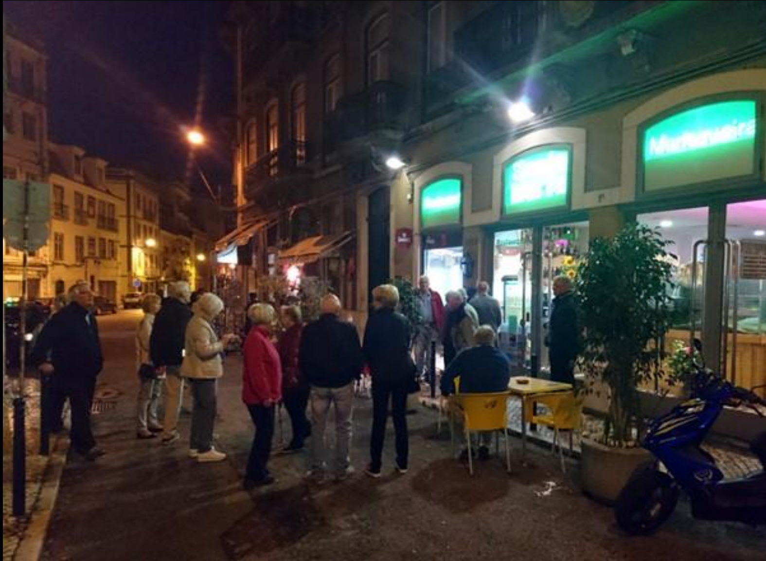
Gemensam middag i Lissabon.