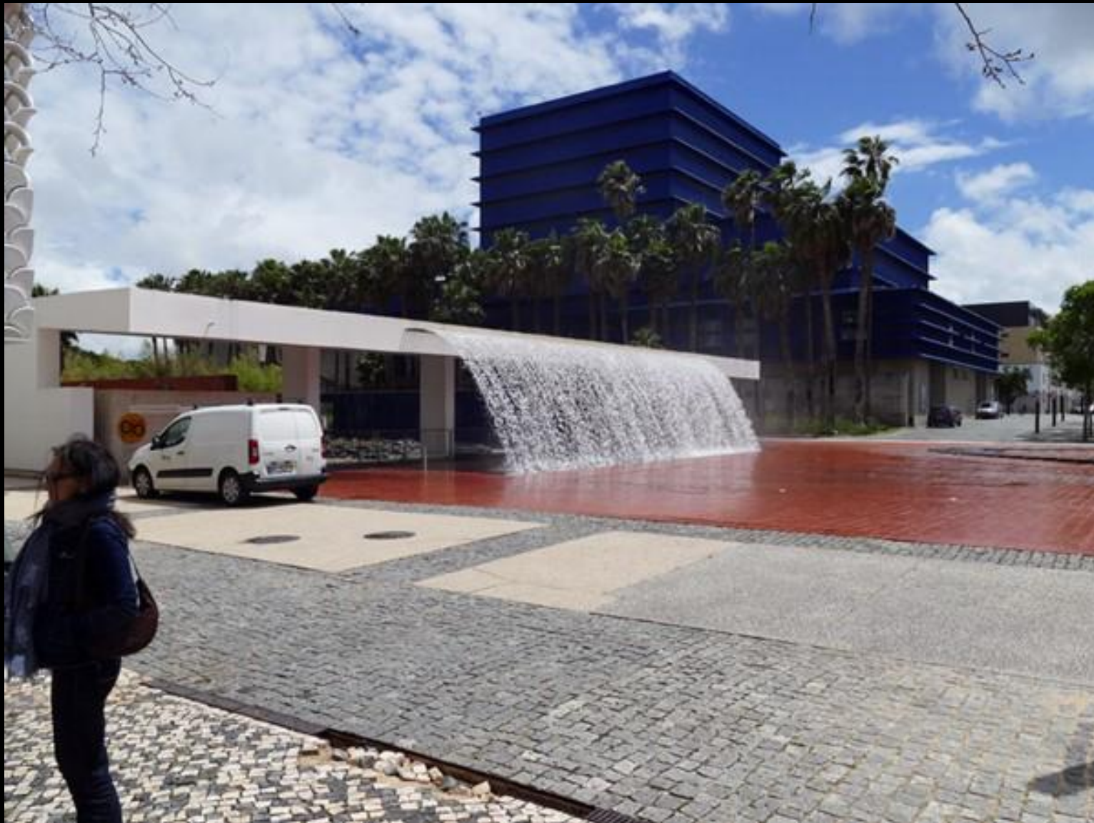
Området kring museientrén.