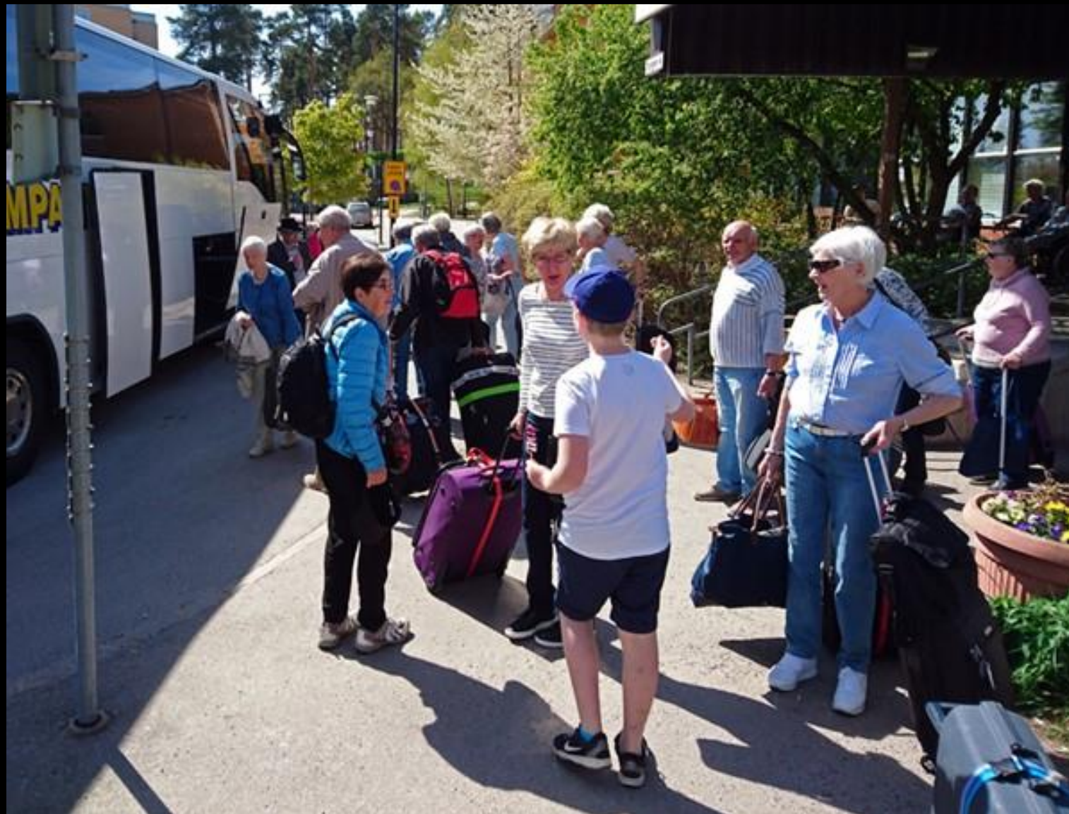
Söndag 8/5: Avresa från Torget 4.