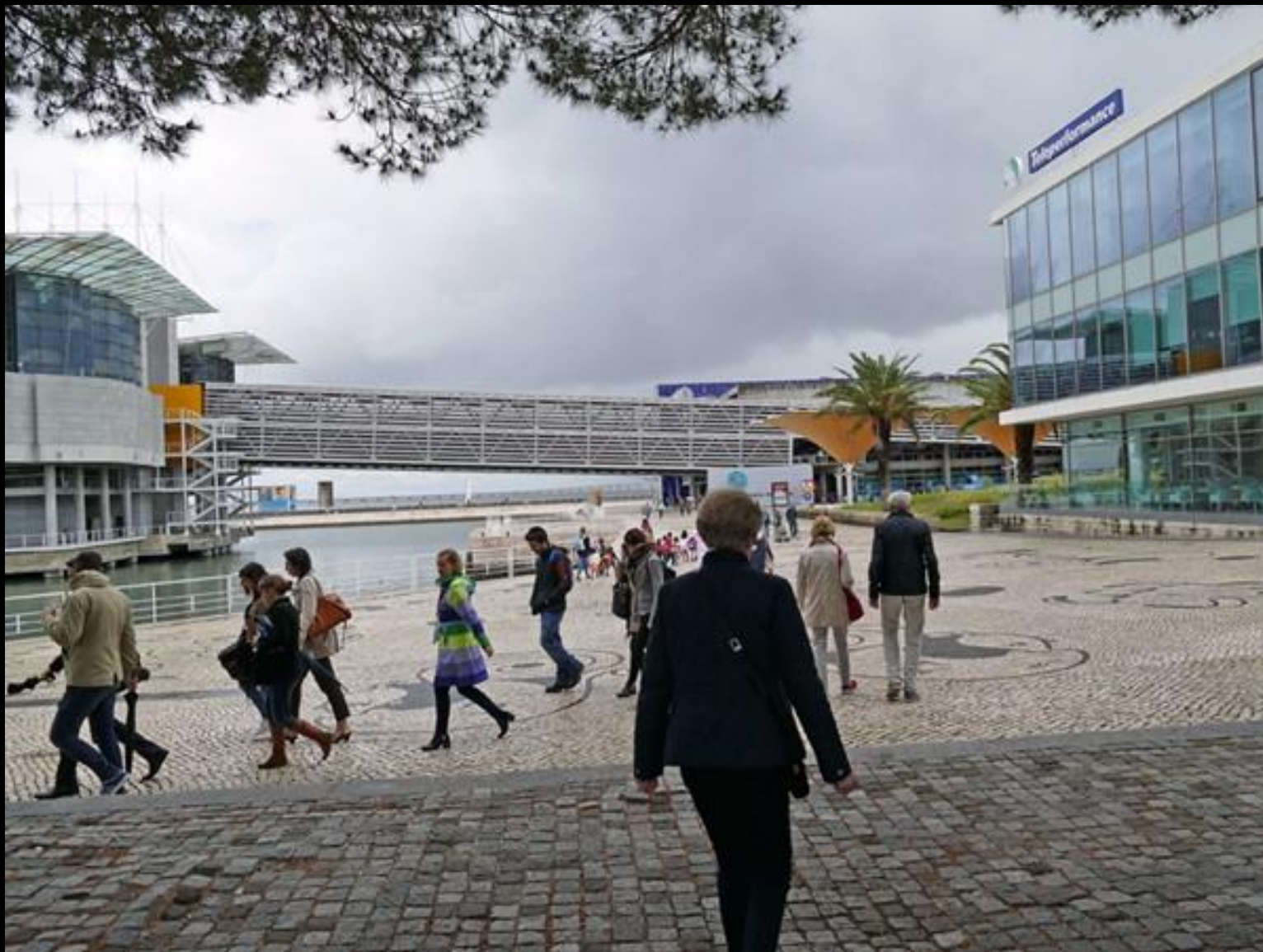
Akvariet till vänster.