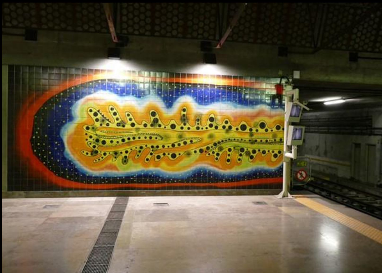
Utsmyckning i tunnelbanan.