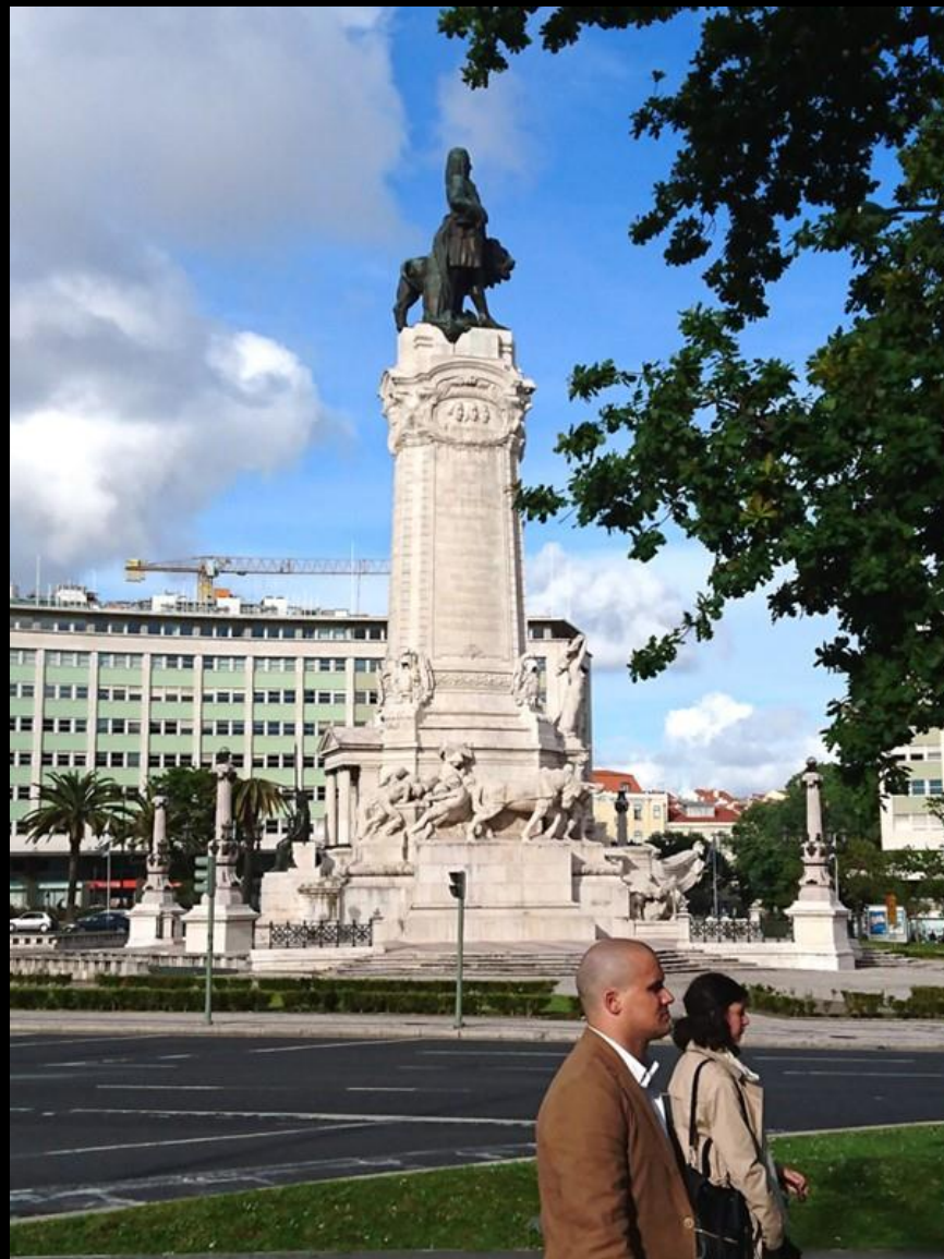
Eftermiddagen fri för egna aktiviteter.