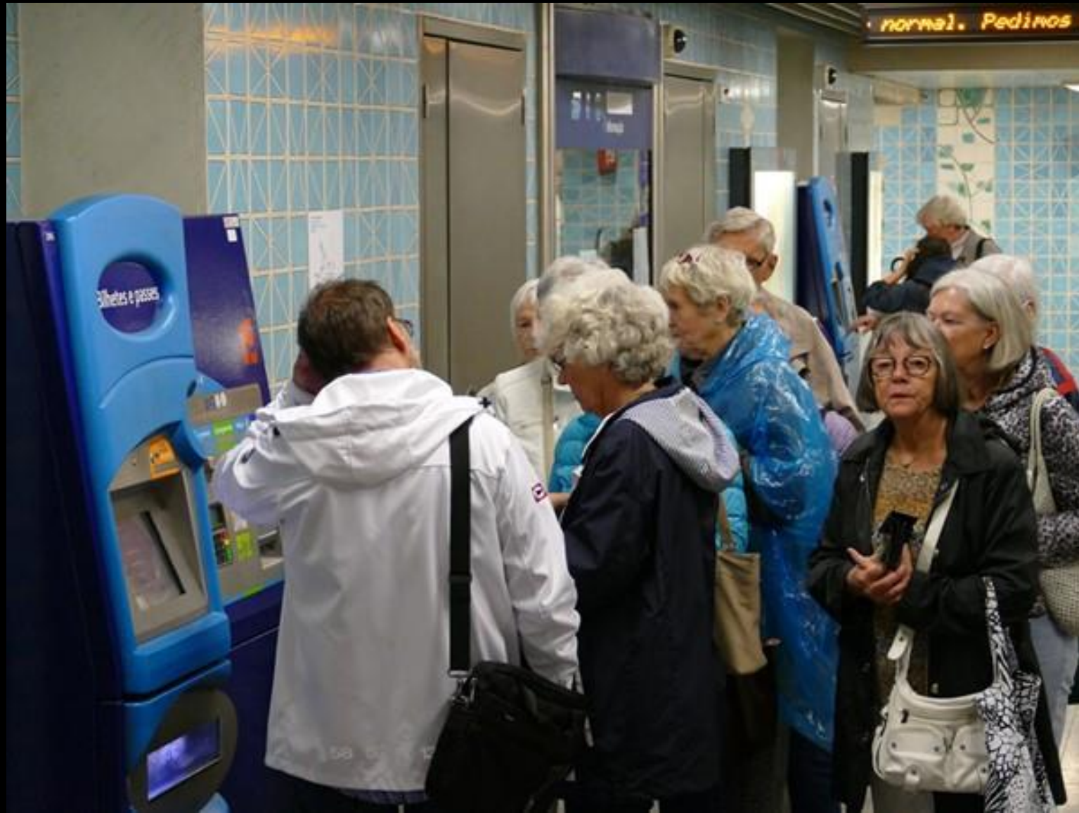
Vi tar tunnelbanan till Oceanário-akvariet.