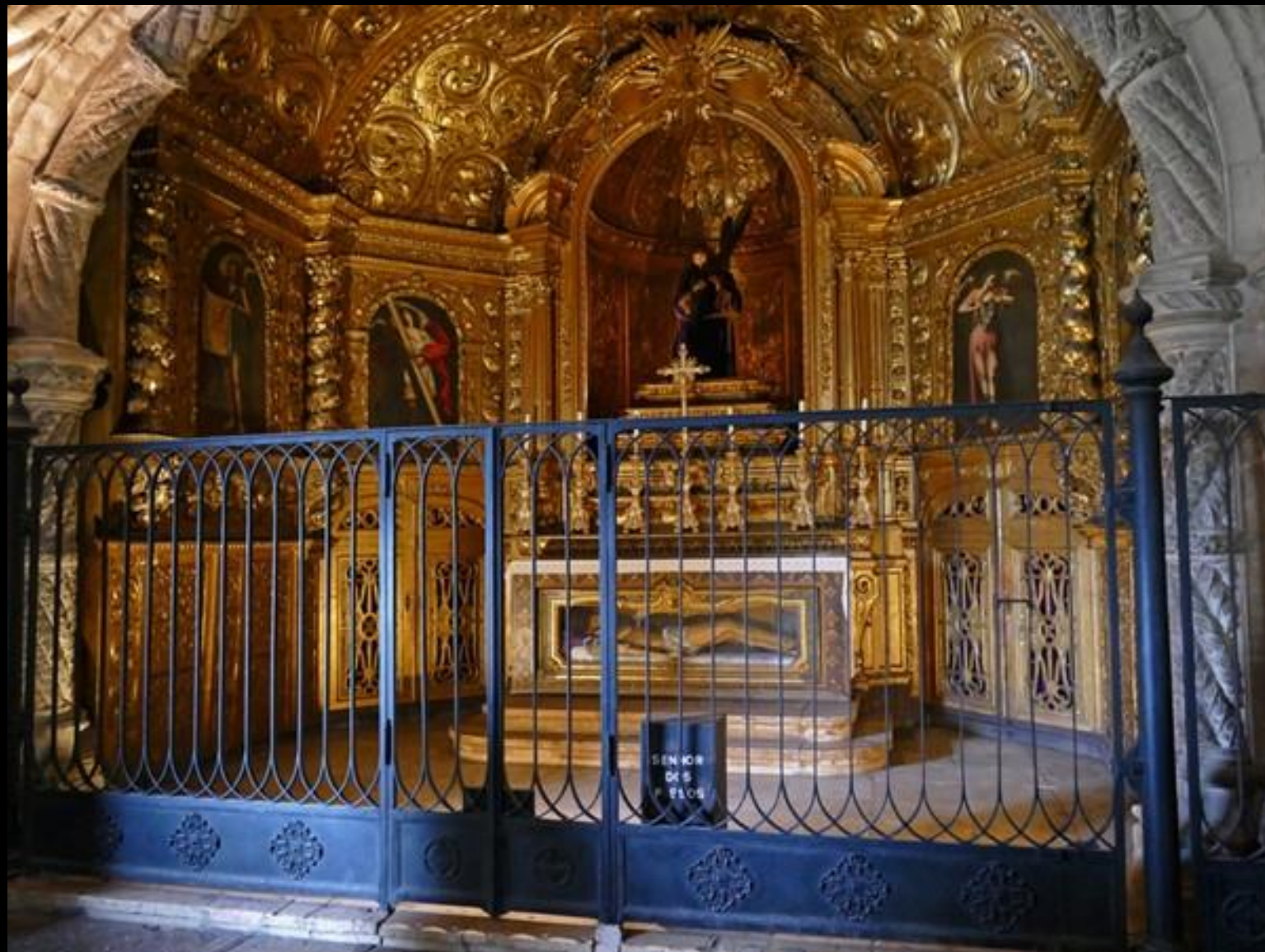
Okänt men vackert gravkor.