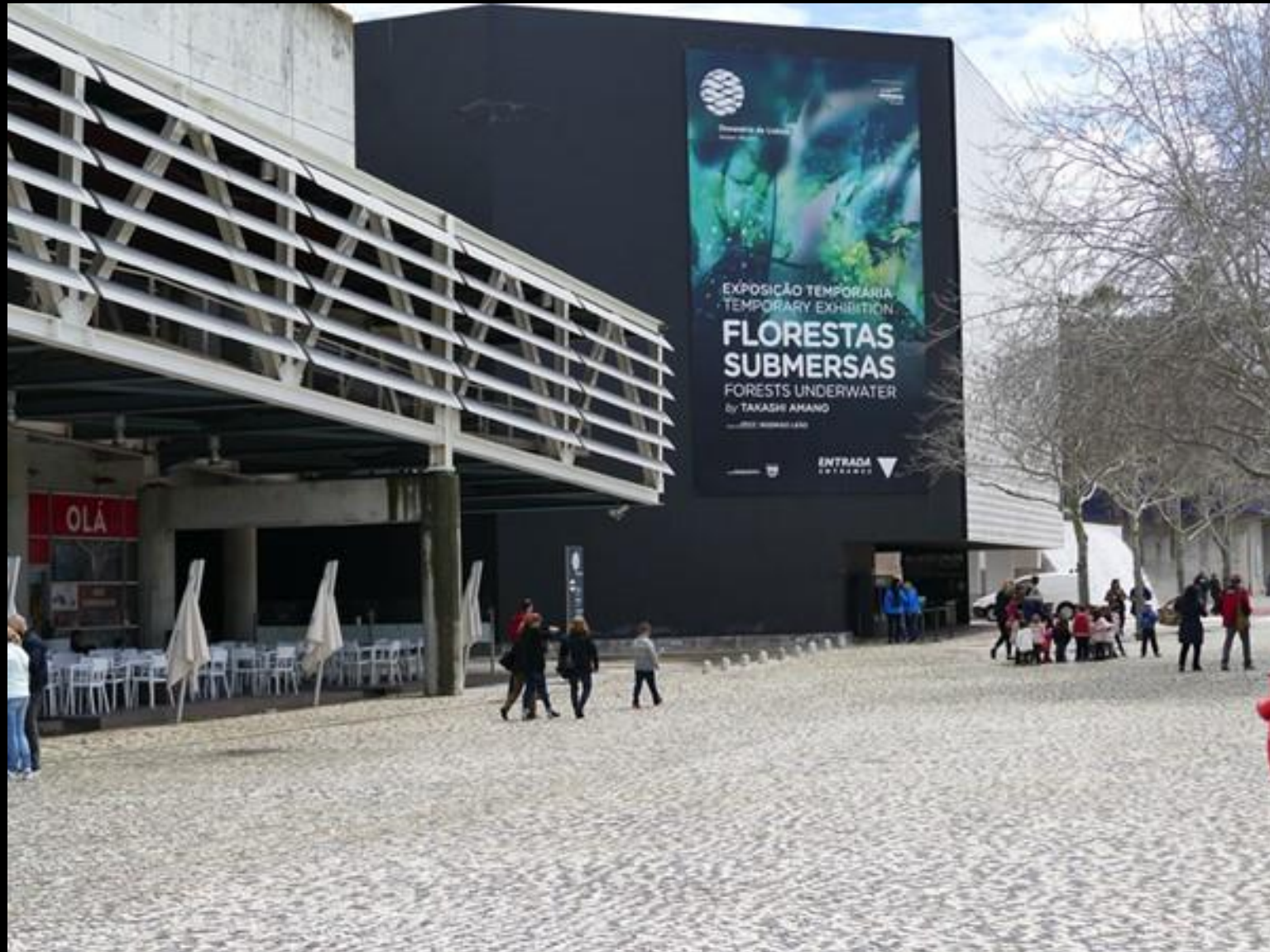
Området kring museientrén.