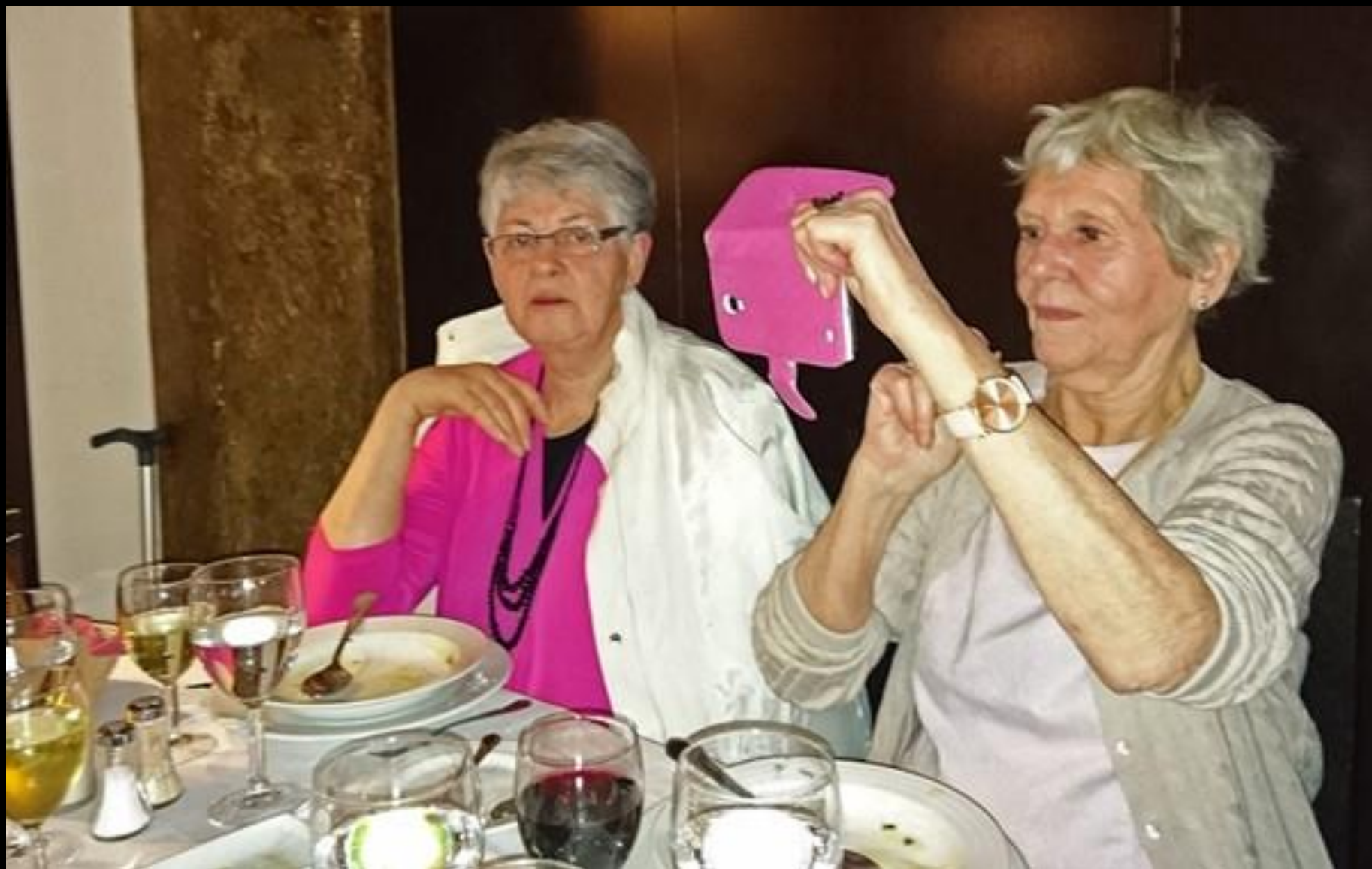
Middag med fado-musik.