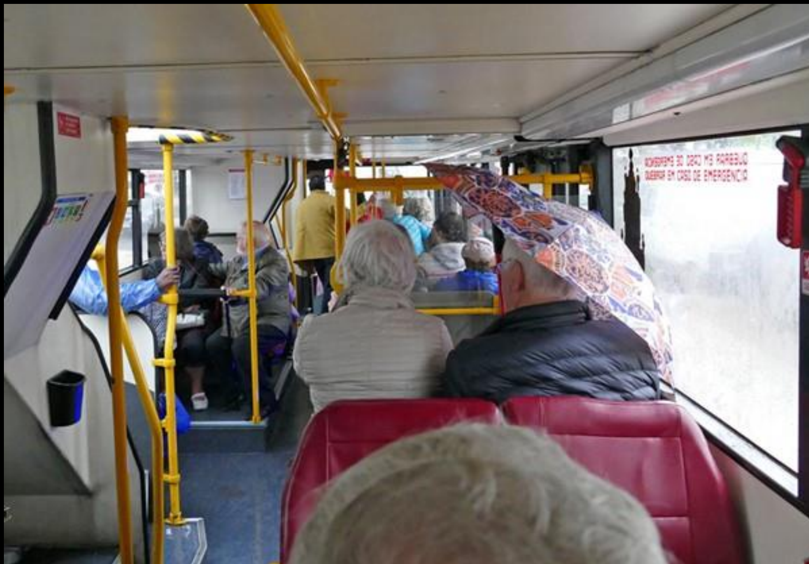
Bussen läckte som ett såll.