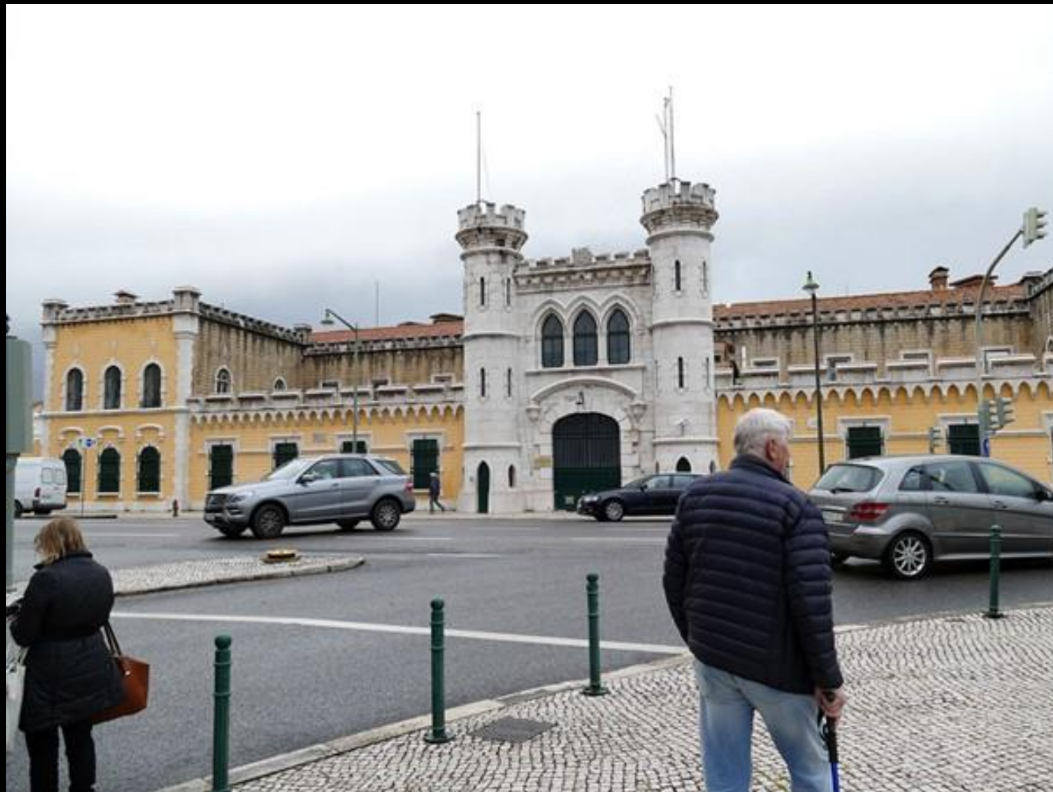
Det vi passerar här är/var troligen ett fängelse.