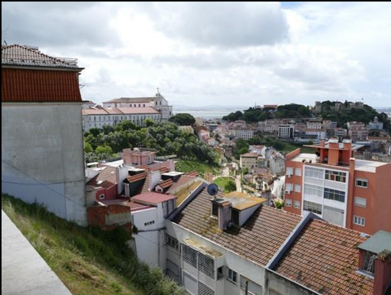
Upp vid utsiktsplatsen vid Senhora do Monte