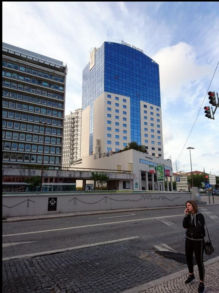
På jakt efter restaurang för intag av middag.