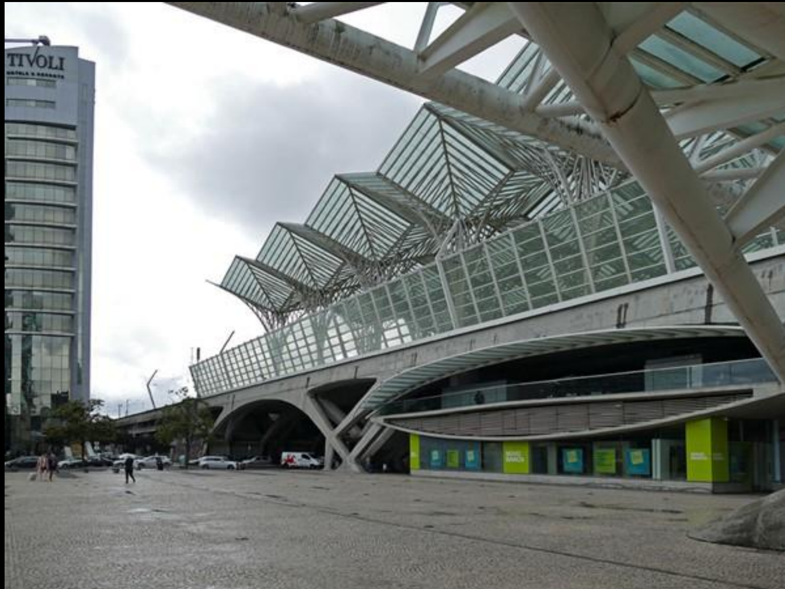
Tjusigt affärscentrum på väg till akvariet.