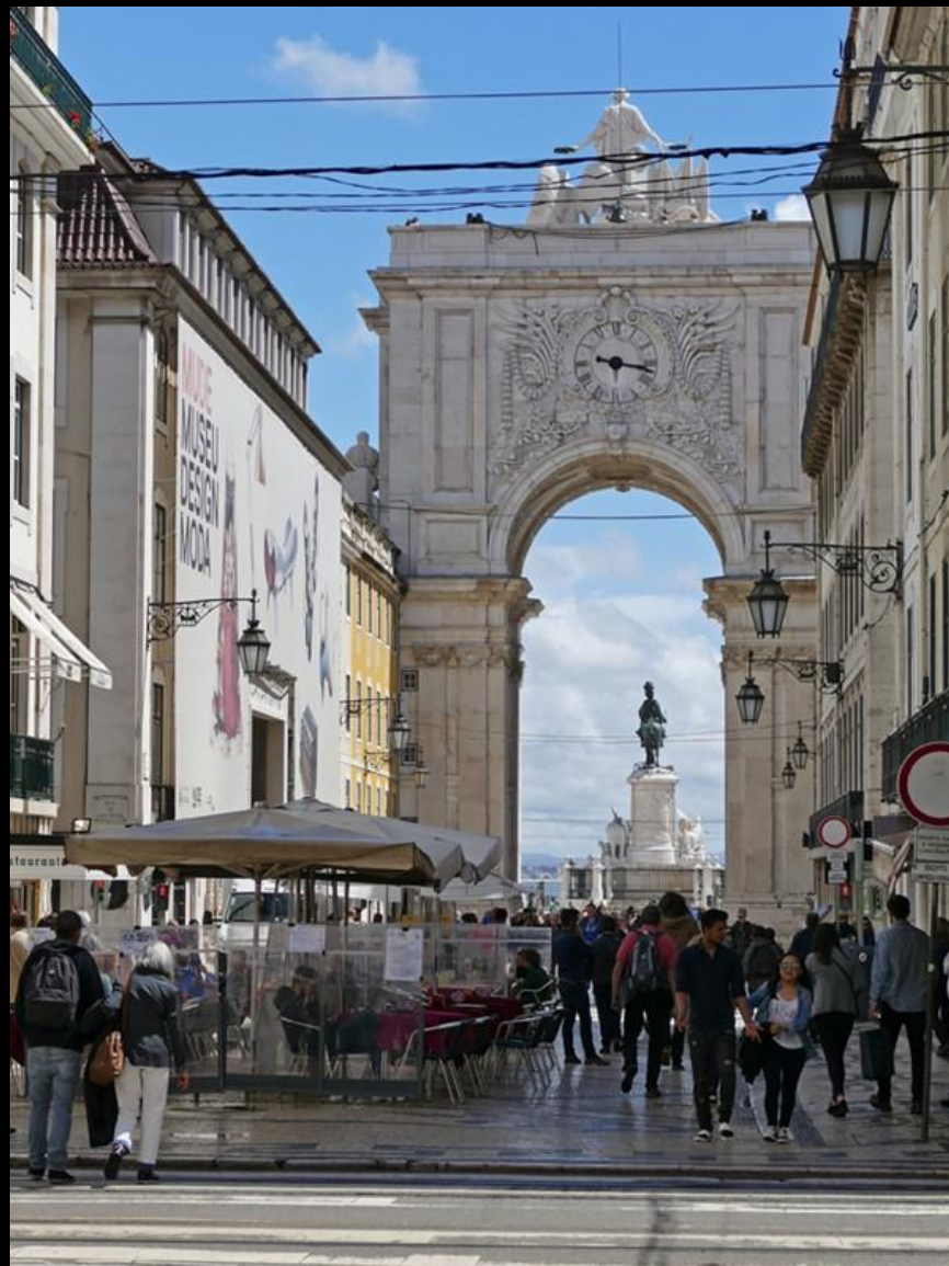
Vandring på Rua Augusta från hamnen till hotellet.