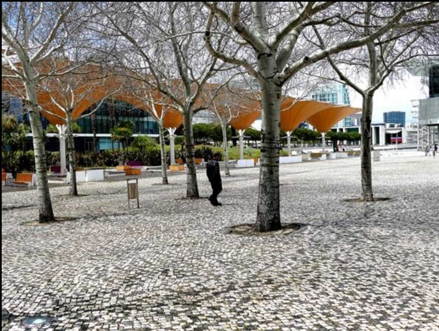
Området kring museientrén.