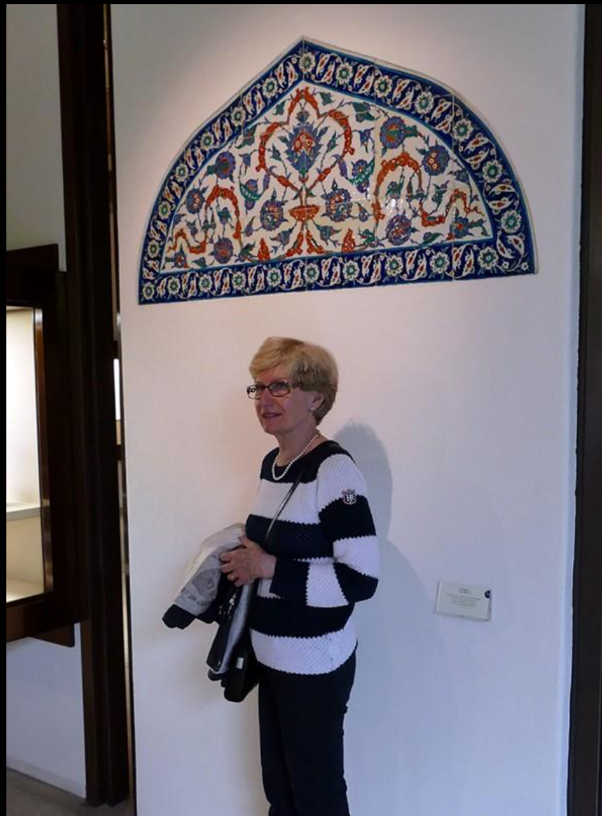
Nästan som en kurbitsmålning.