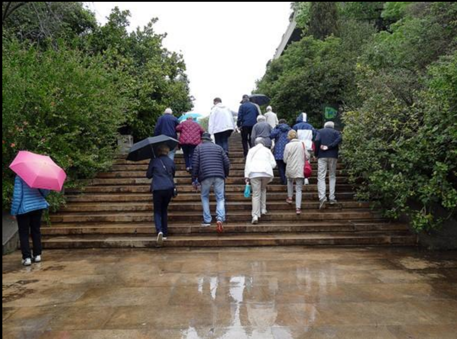
Trappa upp till museet.