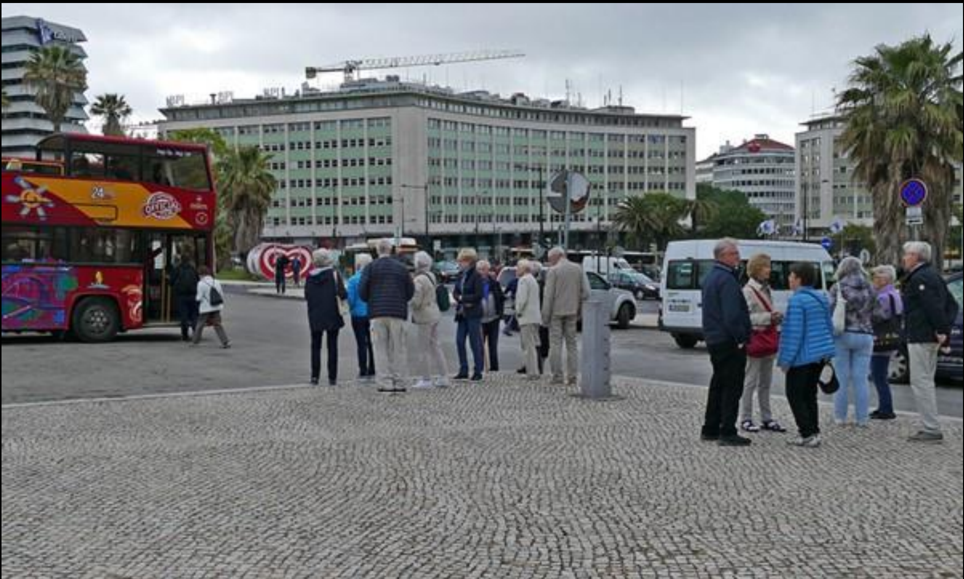
Väntan på egen hop-on-hop-off-buss i regnet.