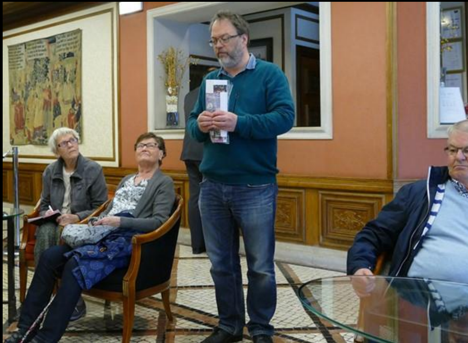
Onsdag: Genomgång inför klosterbesök och middag med fado-sång..