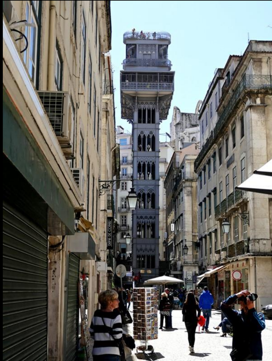
Elevador de Santa Justa. Hiss skapad av lärjunge till Gustave Eiffel.