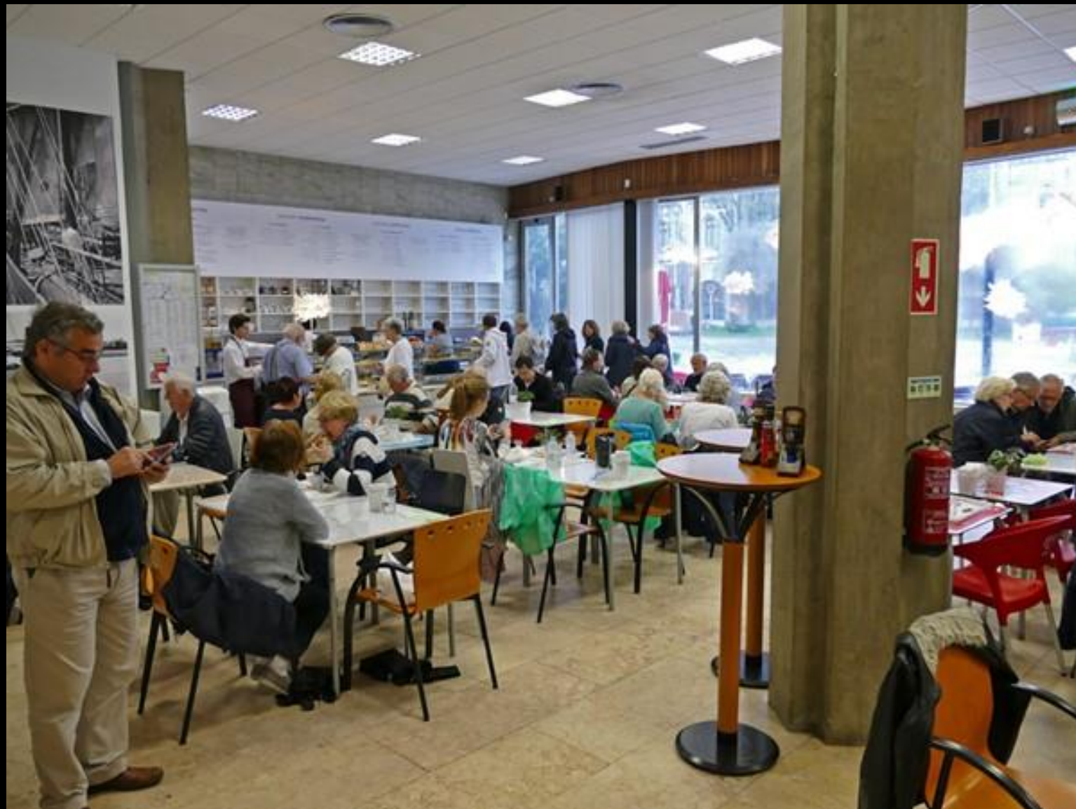
Lunch- och fikaställe intill klostret.