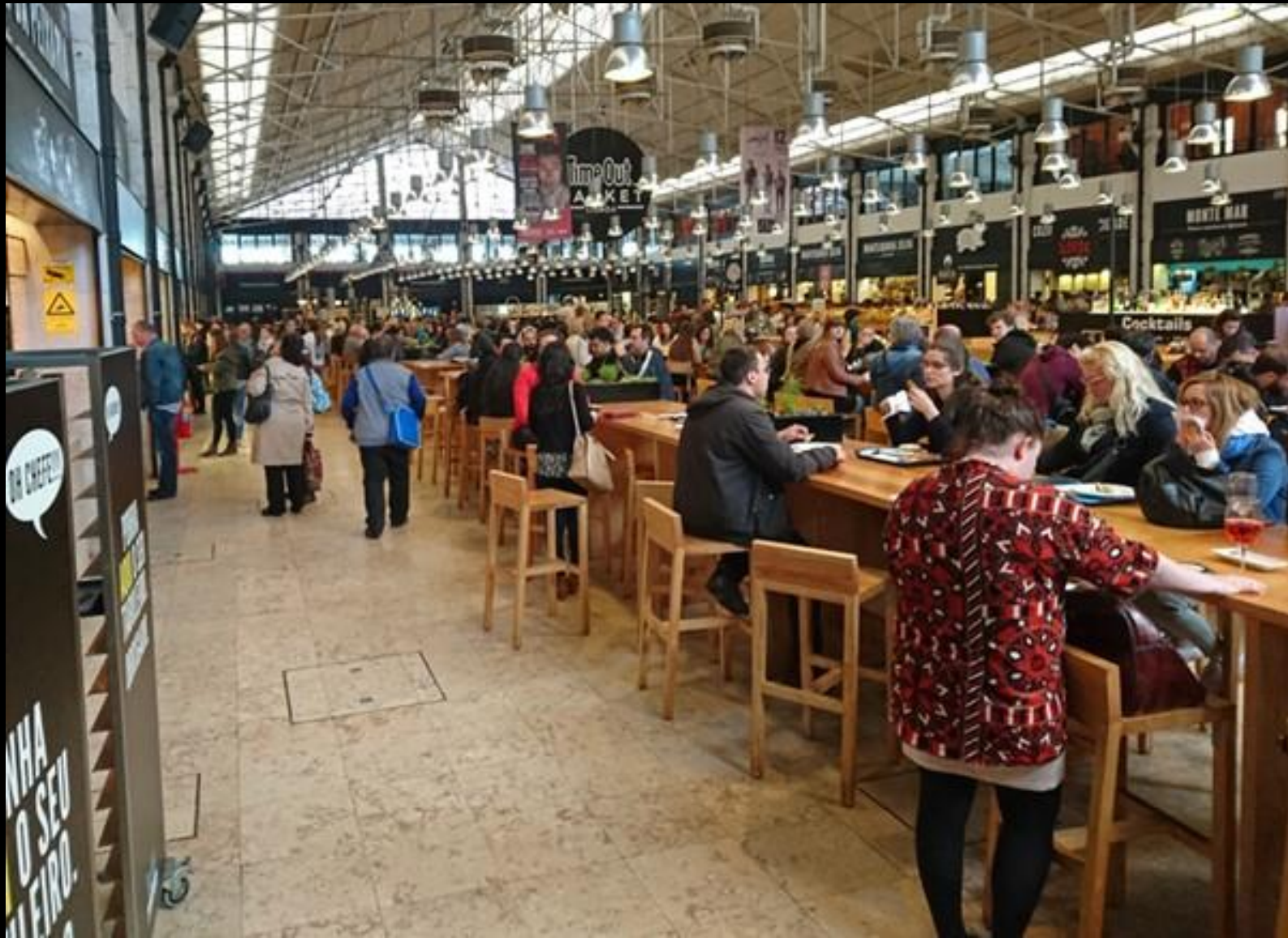
Middag på en matmarknad.