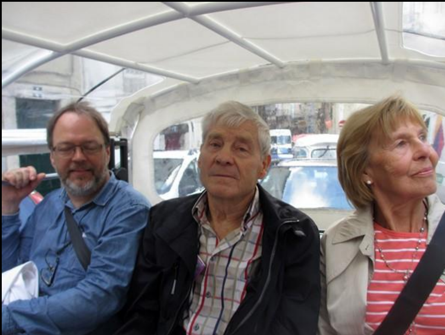
Dags att åka vidare till loppmarknad och begravningskyrka.