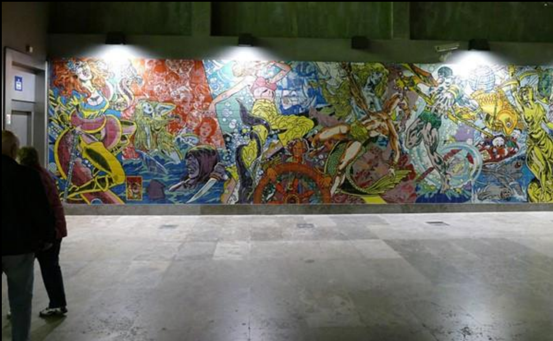
Utsmyckning i tunnelbanan.