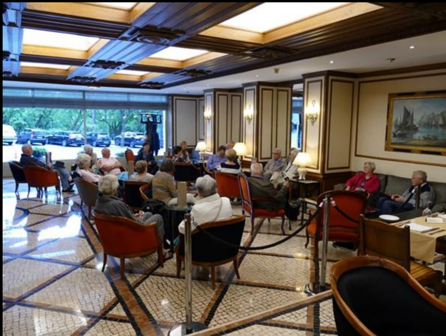
Måndag morgon. Samling i receptionen.