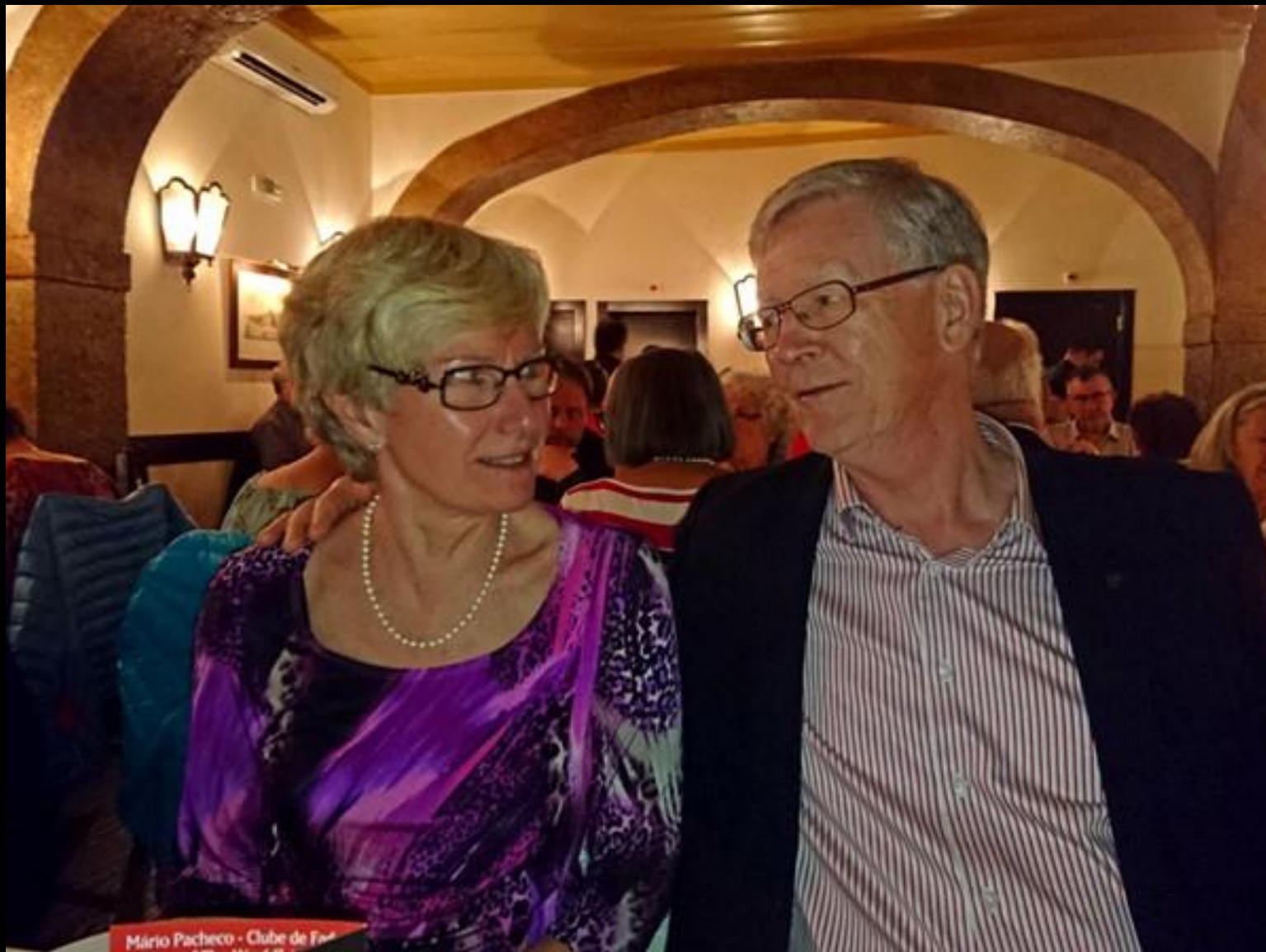
Webbansvarig med hustru.