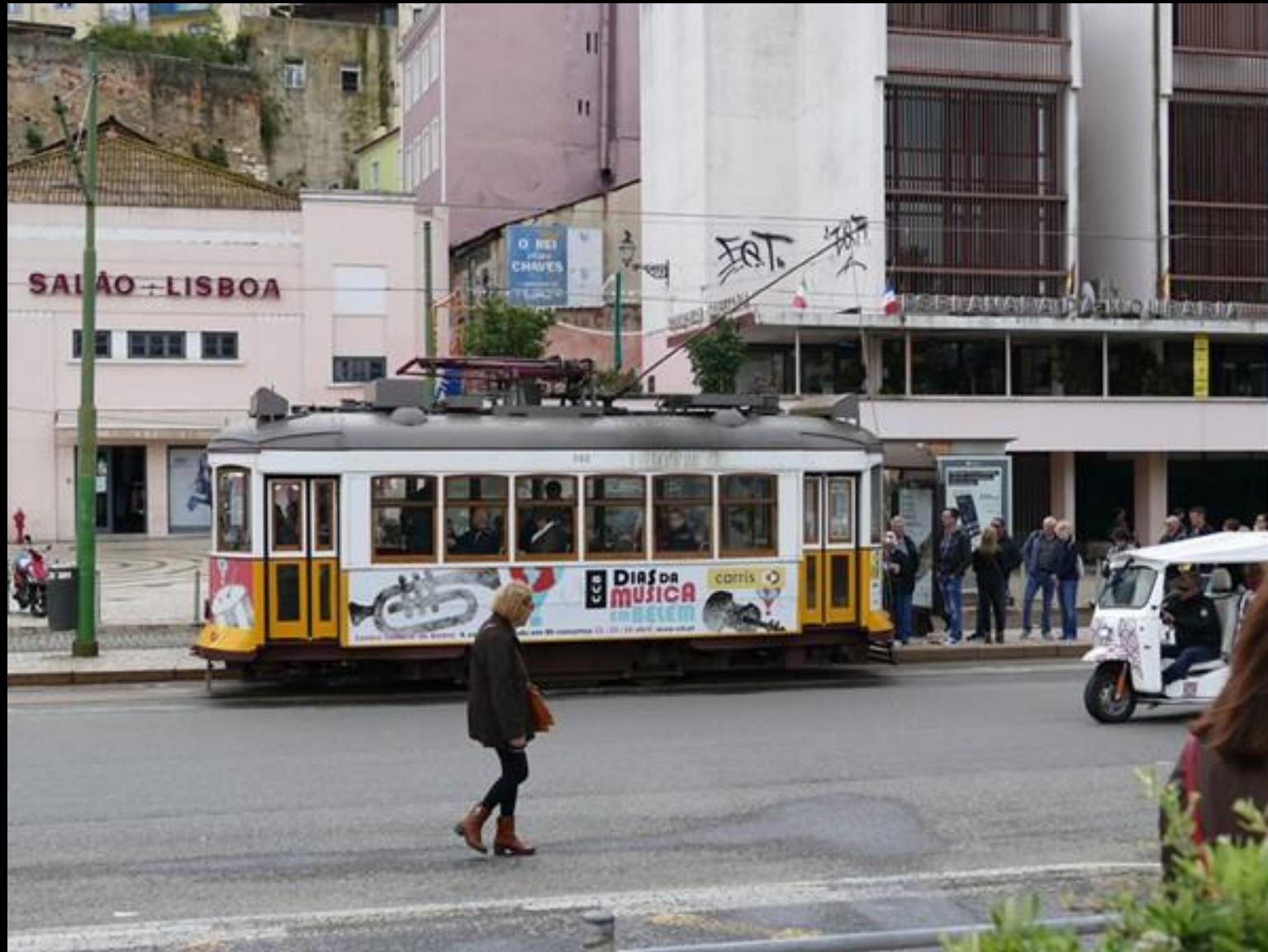
Lång kö till spårvagnen.