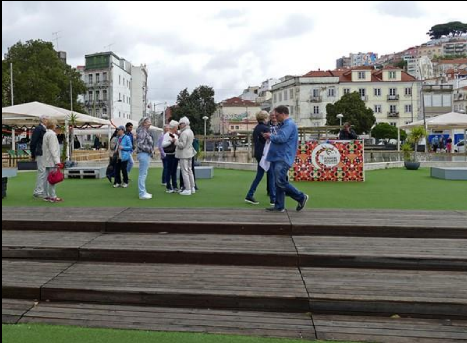
Letar efter några som skulle ta taxi hit.