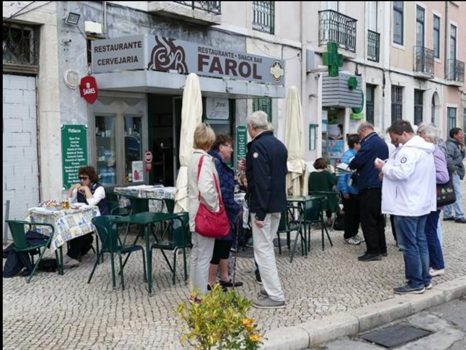
Efter mycket sökande hittar vi ett bra ställe.