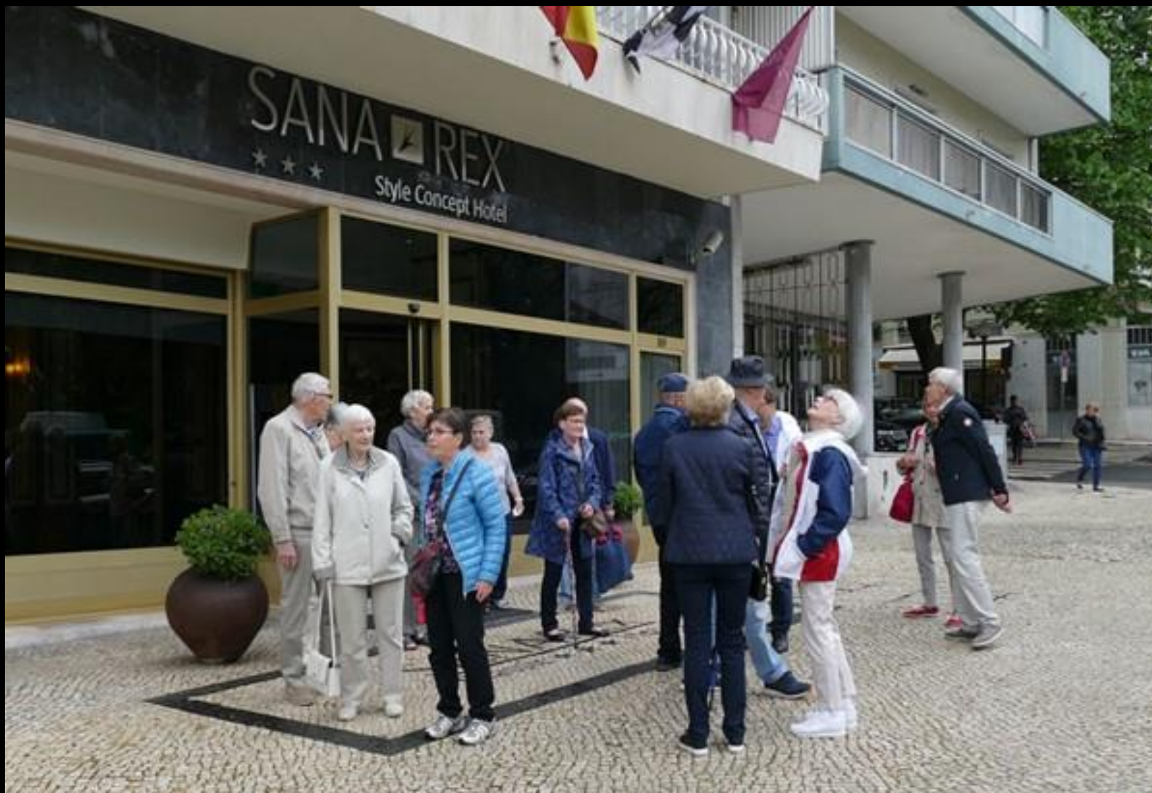
Nu blir det promenad till Calouste Gulbenkian Museum