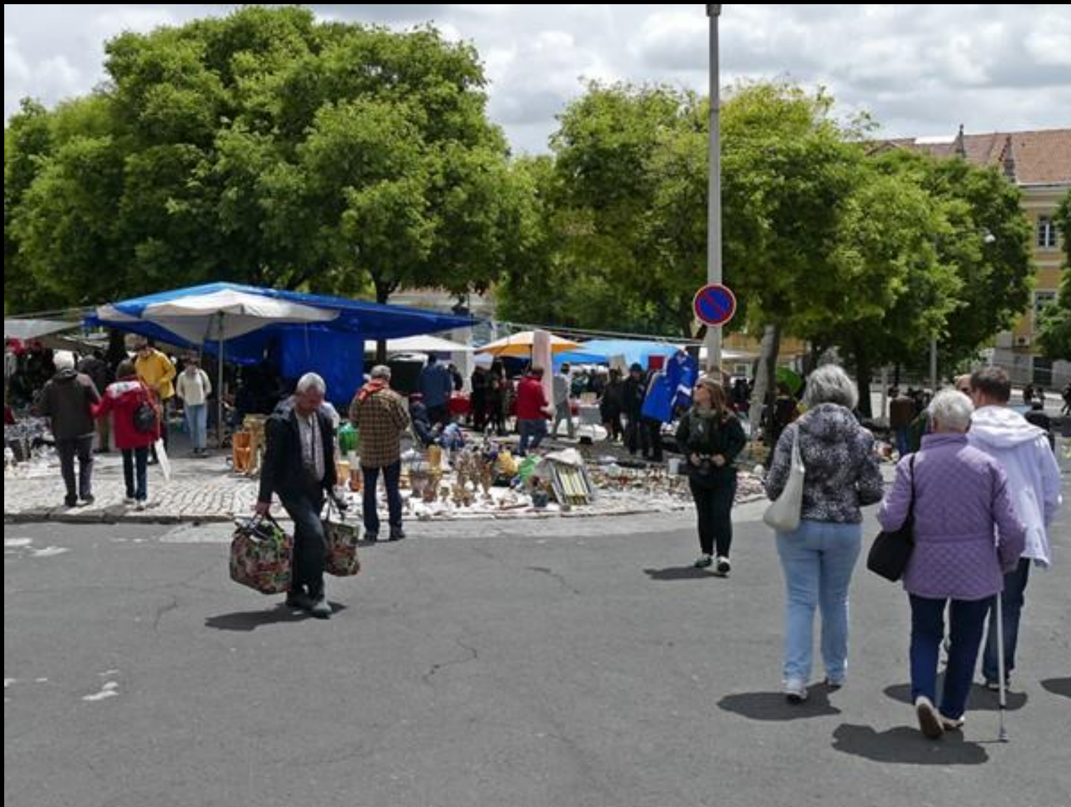
Tillbaka till loppmarknaden.