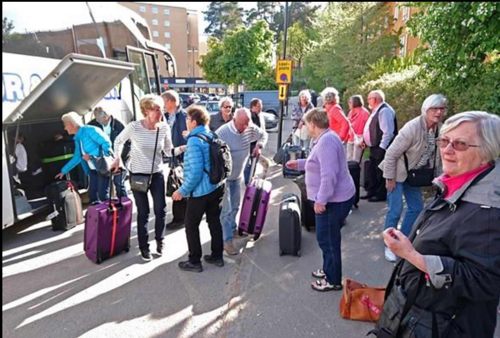
Torsdag. Och så plötsligt är vi hemma igen.