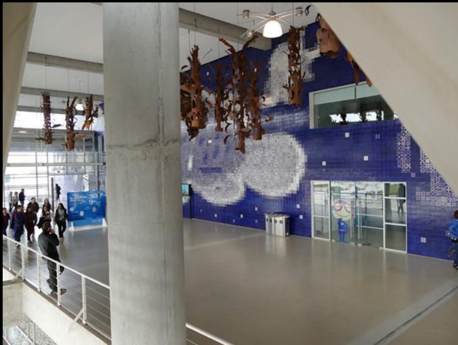
På väg in i akvariebyggnaden.