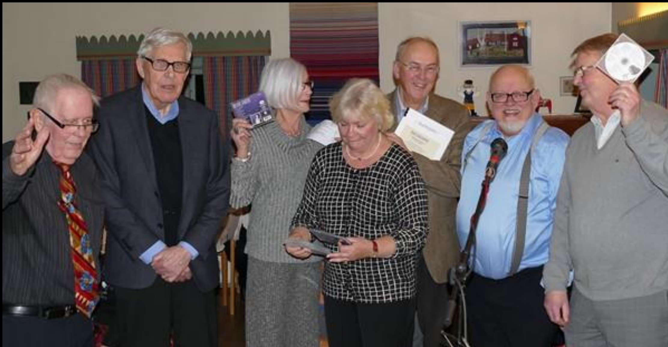
Några av vinnarna i frågesporten.