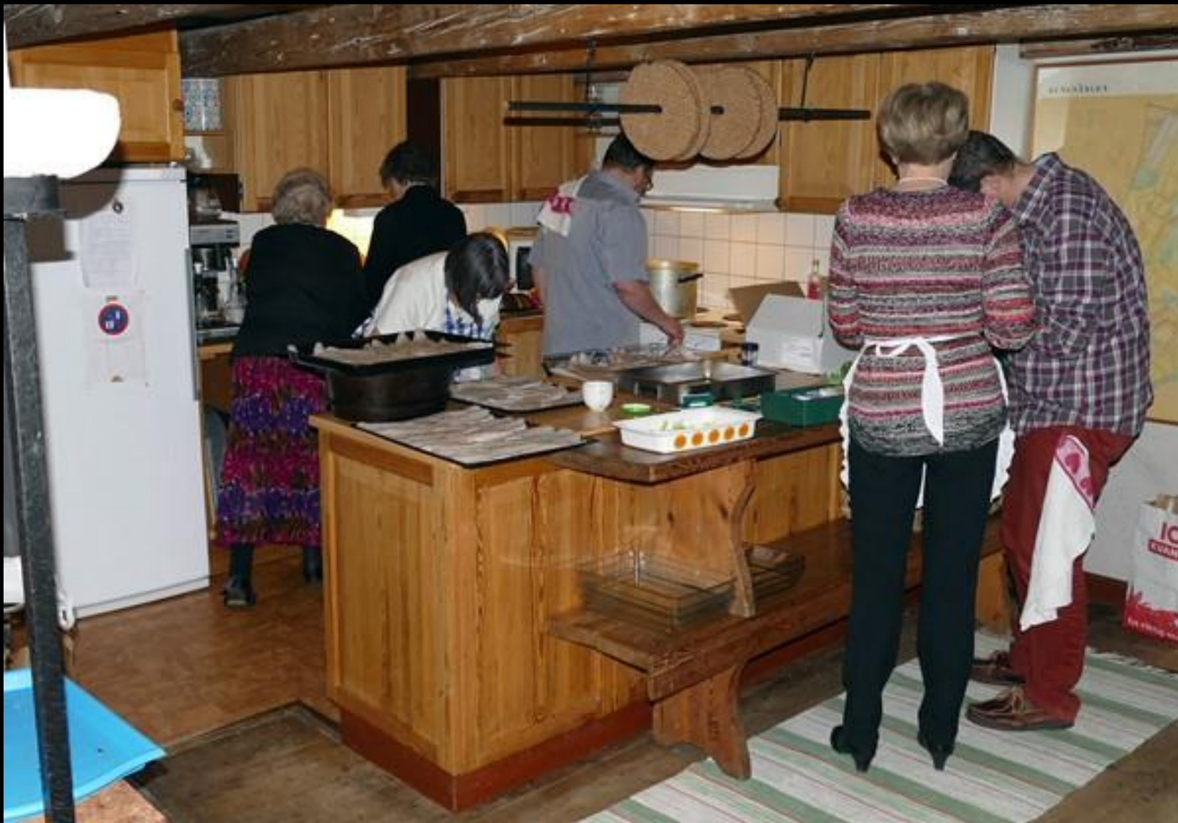
Full aktivitet i köket.