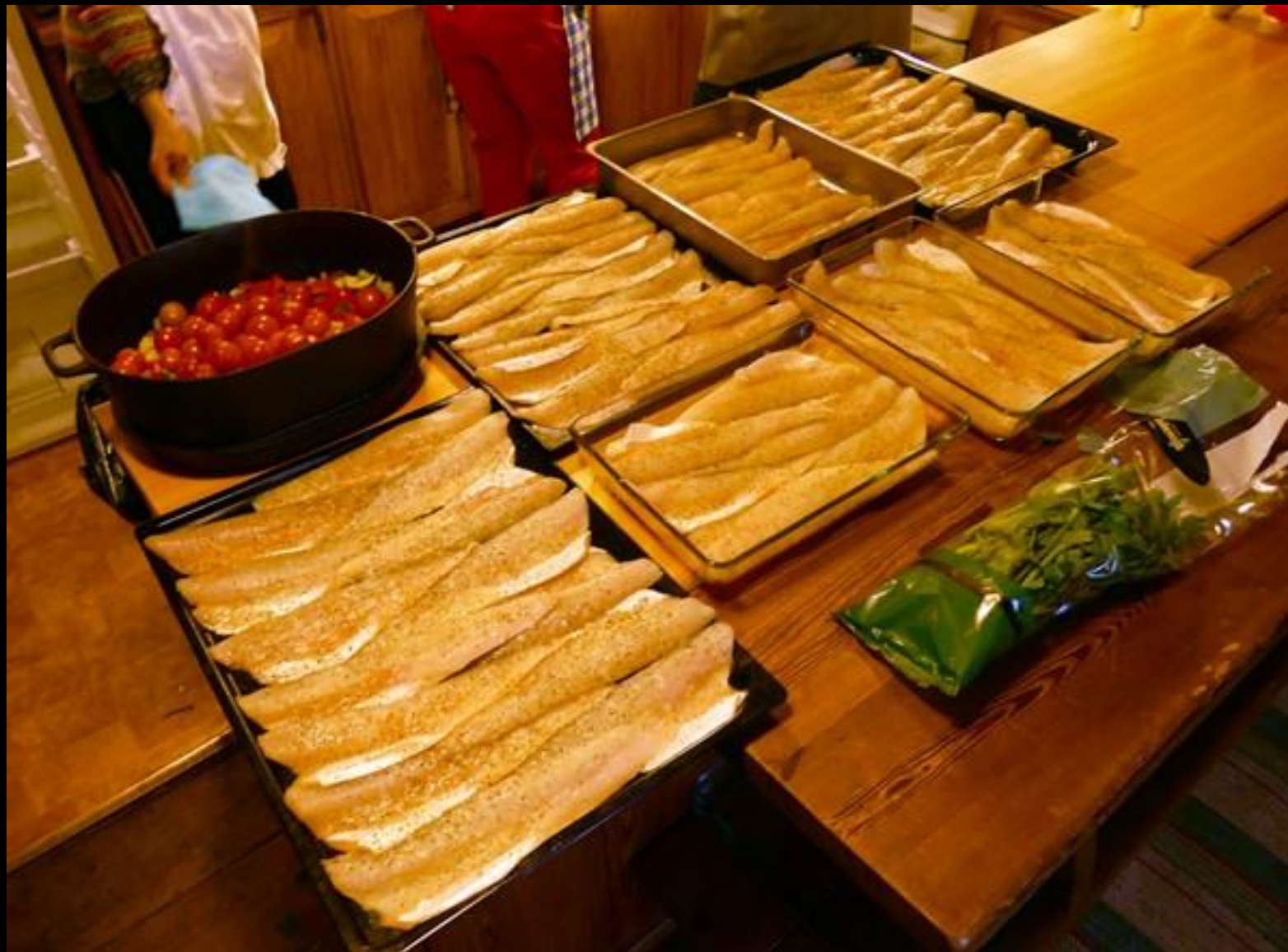
Gös-es va' mycket fisk!