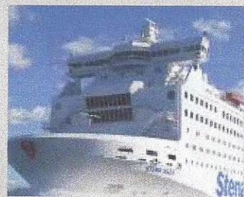
Stena Lines färja