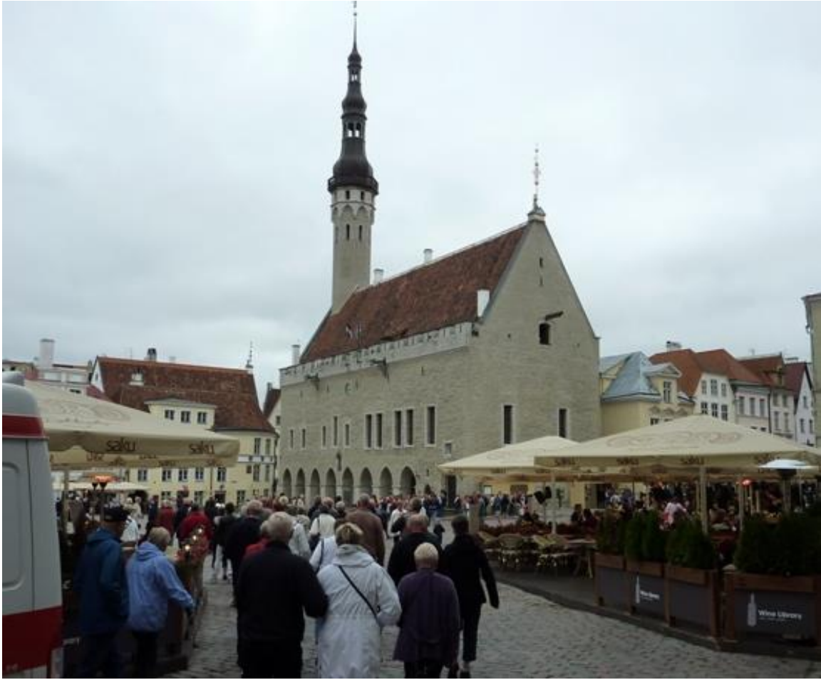
Rådhuset, från 1400-talet