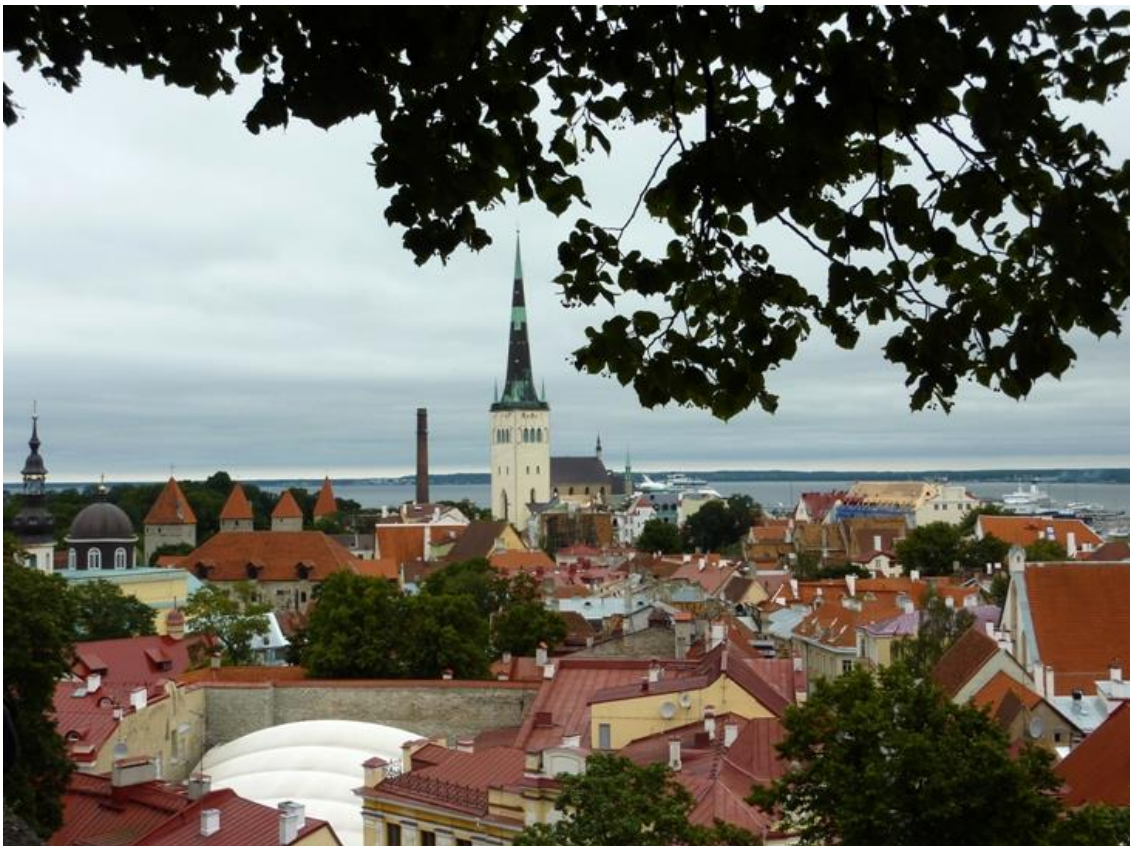
Utsikt från Domberget över gamla stan.