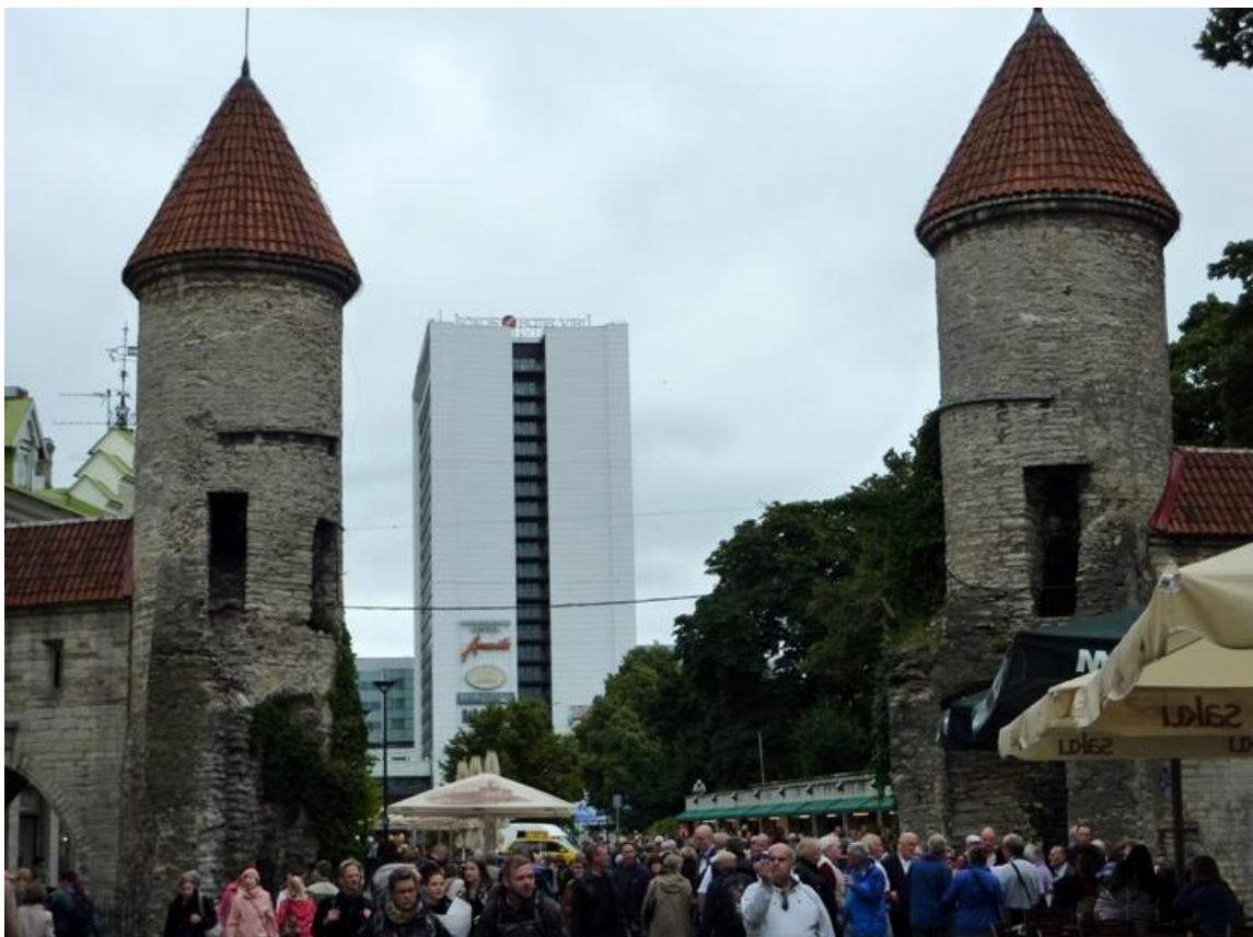
Gammal och ny bebyggelse möts