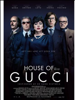
House of Gucci Onsdag 6 apr 14.00 Speltid 2 tim 37 min