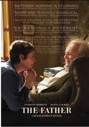
The Father Onsdag 12 jan 14.00 Speltid 1 tim 37 min

Fyra nya filmer speciellt utvalda av Cnema och SPF Seniorerna visas dagtid på Cnema. OBS! att giltigt covidbevis samt leg måste uppvisas Även svenska filmer textas. Filmserien om 4 filmer kostar 190 kr . Det går bra att betala med Swish men vi tar inte kort.