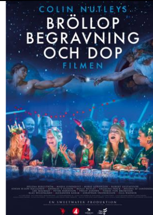
Bröllop, begravning och dop Onsdag 9 mars 14.00 Speltid 1 tim 48 min

Vid kontantbetalning gärna jämna pengar. Abonnemangskortet för medlemmar i SPF Seniorerna säljs onsdagen 12 januari 13:00-13:45 på Cnema.