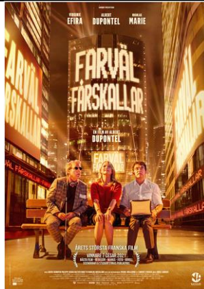
Farväl fårskallar Onsdag 9 feb 14.00 Speltid 1 tim 27 min