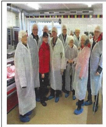
Studiebesök på Carlströms Chark