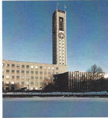
Bilden från fotoakuten