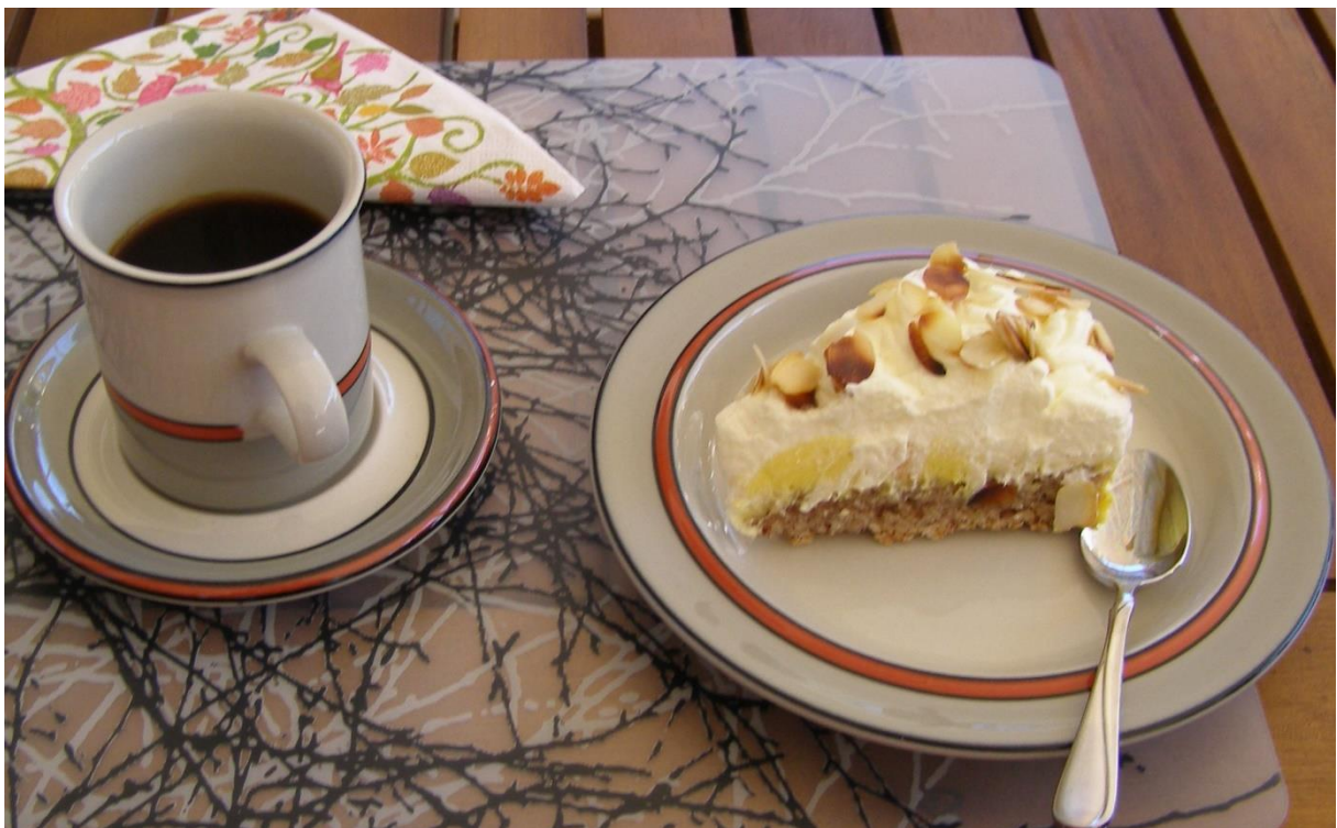
Elvy bjöd även på kaffe och bakelse. Bestående av botten med nötkaka, ägggröra, vispgrädde och mandelflarn.