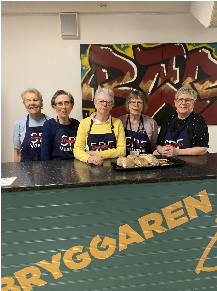
Goda mackor från Guldkringlan bjöd dagens kaffekommitté på!