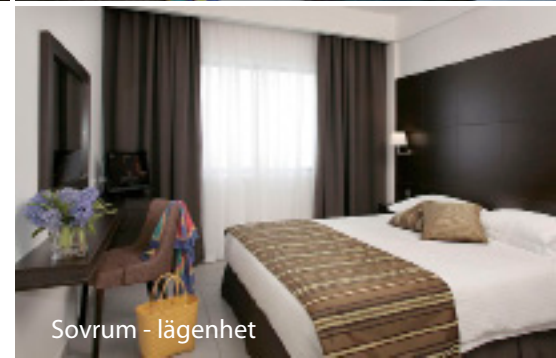
Sovrum - lägenhet