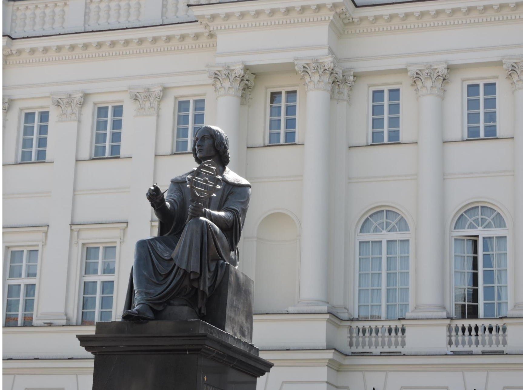
Kopernikus, en staty med symboler för planeterna, som visar dess läge i förhållande till solen.