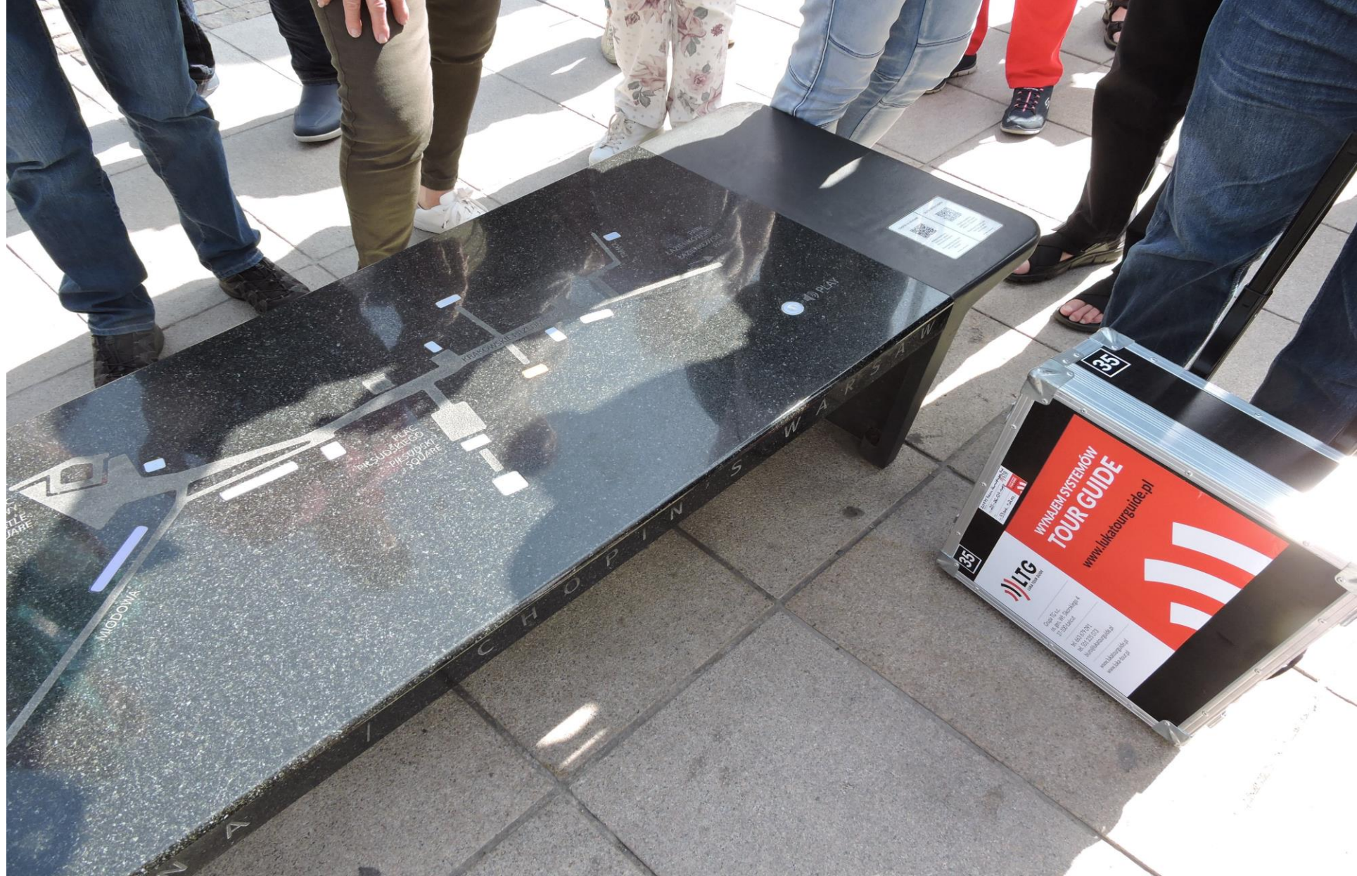
En av ett flertal bänkar, där man kunde spela upp verk av Chopin