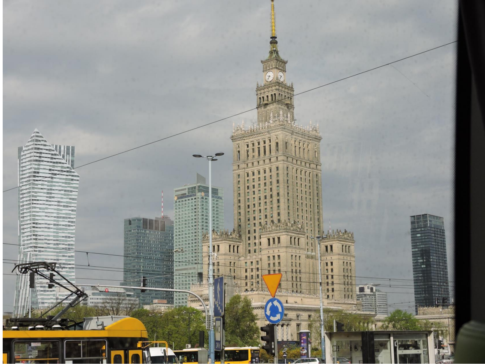
Kulturpalatset, "Gåva" från Stalin