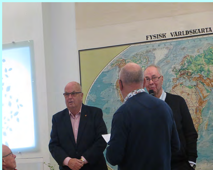
De nya medlemmarna fick presentera sig och berätta om hur de kom att välja vår förening.