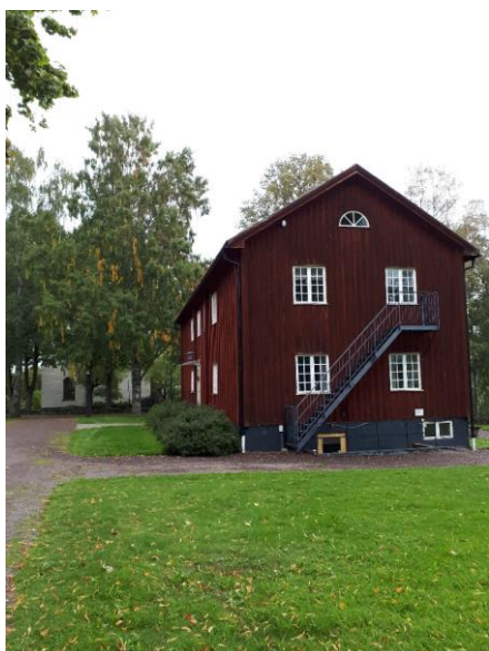
Församlingshemmet i Östra Ämtervik