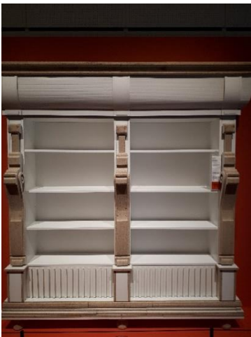
Från utställningen det omgjorda möblemanget. Bokhyllan är försedd med typ "grekiska kolonner."

I anslutning till muséet fanns en aktuell shop och ett innovativt museum vars alster var omgjorda, tillverkade av befintliga Ikea möbler.