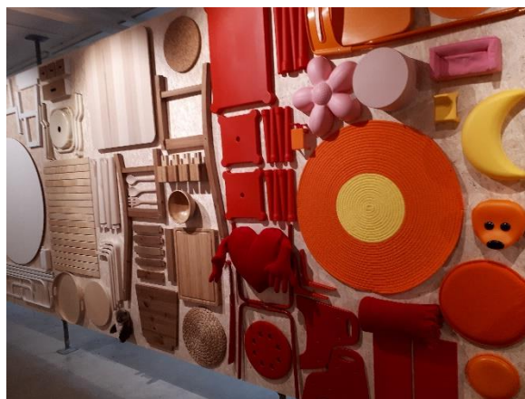
Produktionsgången på höger sida.

Vi guidades genom den färgglada produktgången, som kändes ombonad och mysig och därefter hela kedjan av årtiondens olika produktioner med varierande material och färger.