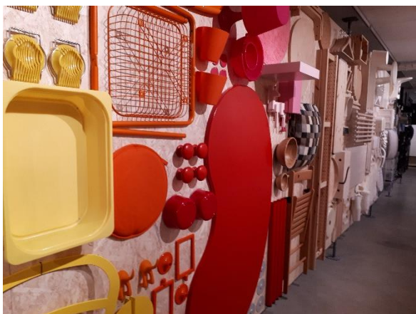
Produktionsgången på vänstersida.

Orsaker, vad som från första början gjorde Ikea så framgångsrik, var skogen, järnvägar och Älmhults placering samt prisfaktorn bland annat.