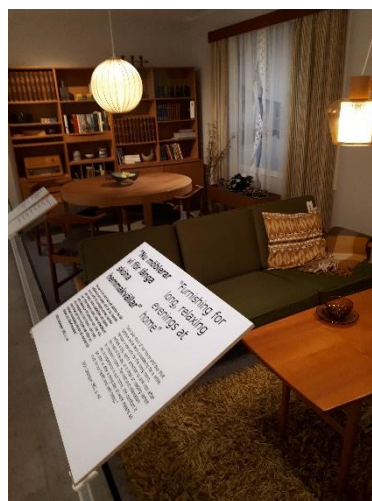
Ikeas möbelstil växer fram.