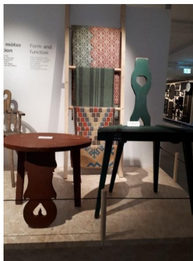
Från Ikeas tidigare produktion.