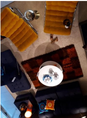
Upp och ner rumsinteriör på innertaket.

Ett par annorlunda inslag var att två stycken rumsinteriörer var fastsatta upp och ner på innertaket. Ett av dem var jeansstygerperioden i fåtöljer och soffor.