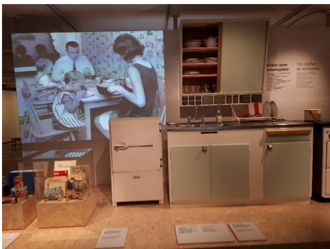
Från 50-talets kök med låga arbetsbänkar och små kök, gjorda för ensamarbetande hemmafrun.

Vi guidades genom den färgglada produktgången, som kändes ombonad och mysig och därefter hela kedjan av årtiondens olika produktioner med varierande material och färger.