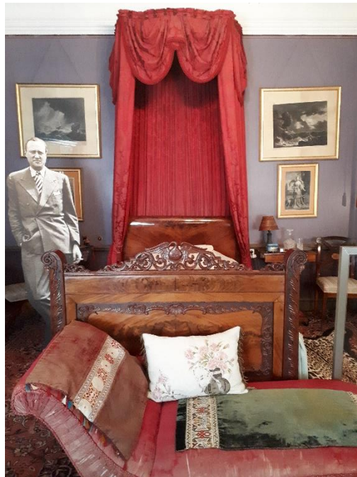
Den kungliga sängkammaren på andra våningen. Oskar II har bl.a. övernattat där och Gustaf V.