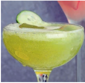
Drinken som är lättare att dricka än uttala

Så här skapar du en Bhoga Belini. Ingredienser för 4 personer: 1 stjälk citrongräs, 1 dl vatten, \frac{1}{2} dl socker (kan du hoppa över om du vill ha en mindre söt drink), en tredjedels gurka och ett halvt urkärnat äpple skuret i bitar, 1 dl äppelmust, Schweppes Ginger Ale, färskpressad citron. Banka sönder citrongräset, skär det i bitar och lägg det i en kastrull. Tillsätt vatten, eventuellt socker och låt koka i 10 minuter. Sila bort citrongräset. Låt lagen kallna. Mixa gurka, äpple, äppelmust och lite citronjuice i en matberedare. Sila bort grönsaks- och fruktköttet. Blanda båda dryckerna och häll upp \frac{3}{4} dl i glas. Fyll upp glaset med Ginger Ale, garnera med citrusblad