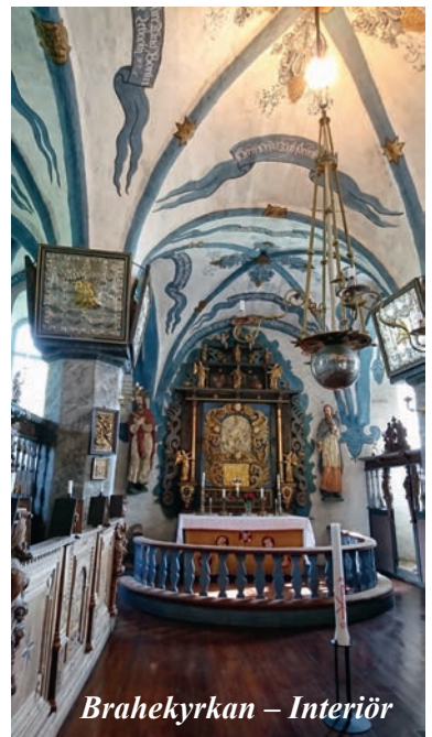
Brahekyrkan – Interiör