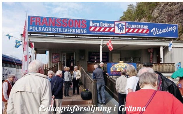
Polkagrisförsäljning i Gränna