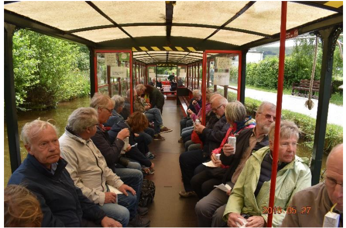
På en kanalbåt i Wales