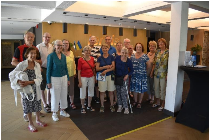
Vi lyckades samla gänget mellan SPA-behandlingarna i Pärnu, Estland.