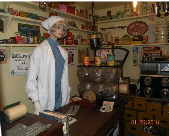
En resa både i rum och tid till Nynäshamn