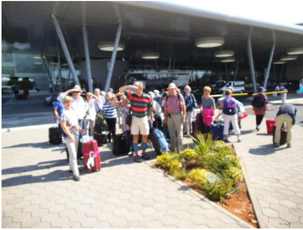
Förväntansfulla resenärer i Montenegro