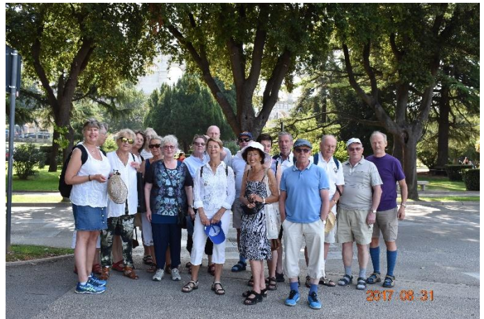
Skuggsidan var inte värre än så här i Pula, Istrien, Kroatien