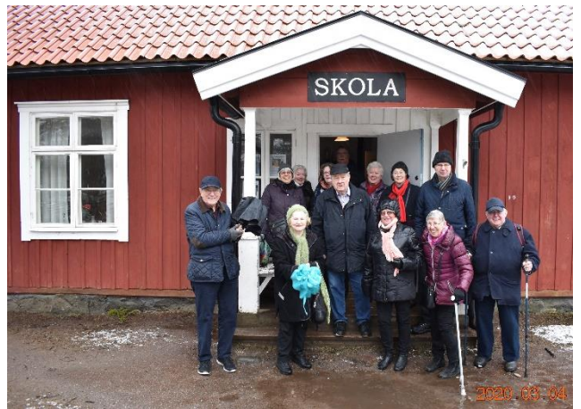
En annan tidsresa till Svartbäcken Haninge