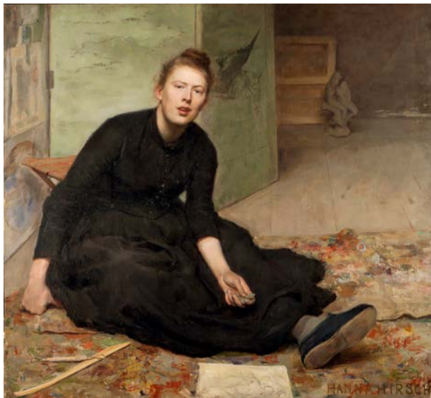
Hanna Hirsch-Pauli, Konstnären Venny Soldan-Brofeldt, 1886–87, olja på duk, 125,5 x 134 cm, Göteborgs konstmuseum.

Äntligen! Sju konstsuktande Spångaveteraner tog sig ut till Waldemarsudde den 16 december för att få lite kulturell stimulans efter många långa månader av pandemi. Det var föreningens konstgrupp som annonserat om utställningen Ett eget rum – Konstnärsrollen under det sena 1800-talet. Klockslaget, 14.00, var som vanligt anpassat för museets allmänna guidning.