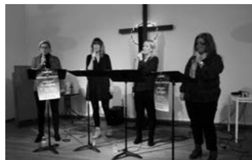
Fahlstedts Flickor.