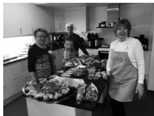
Kökspersonalen vid månadsmötet i full gång.