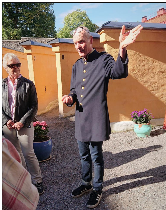
De solfjädersplacerade rastgårdarna