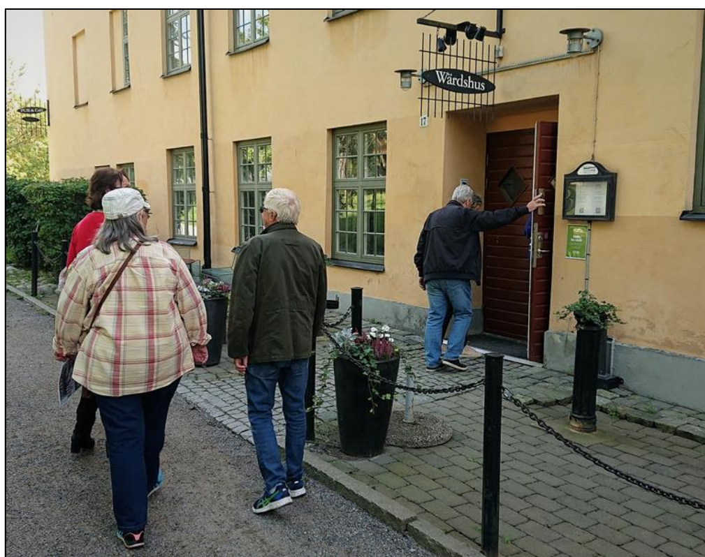
Dags för lunch