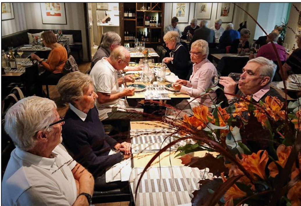
God lunch i trevlig miljö. En deltagare hade redan avvikit när bilderna togs.