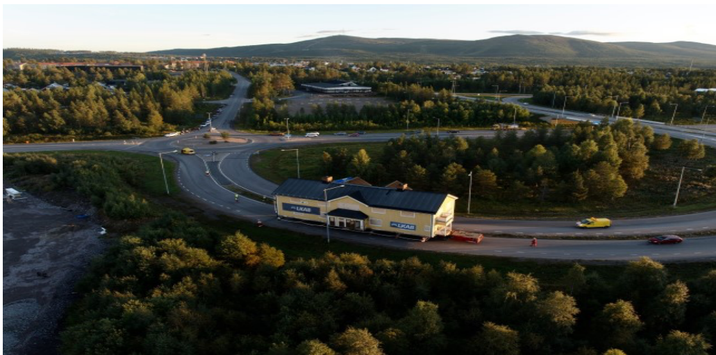
Gällivare-Malmberget som flyttas