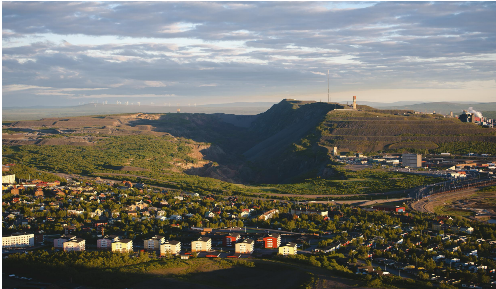
Kiruna-staden som flyttas.