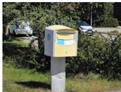
Här startar Stavgången