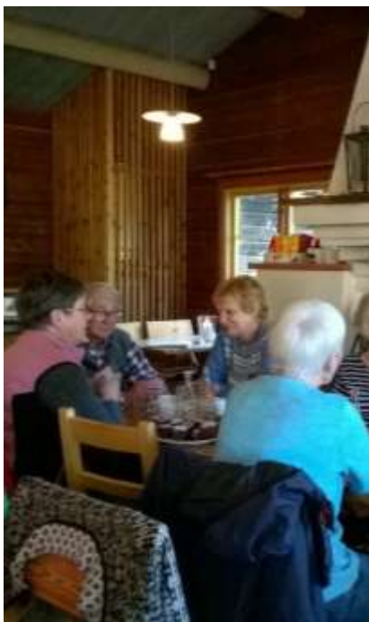
Höstlunch vid Hellasgården 2016