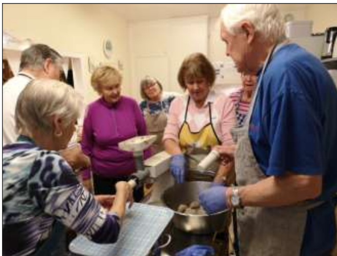
Full fart med korvstopppningen 2018

Anmälan Från 1 november Lokal Föreningslokalen, Albatrossvägen 76 nb