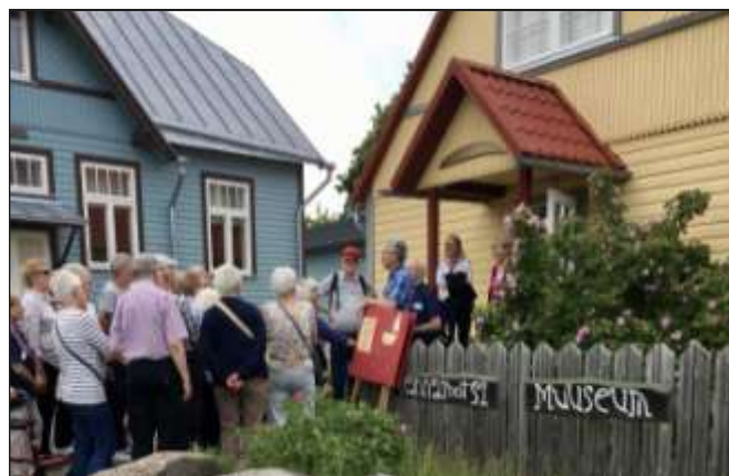
Vid Aibolands museum