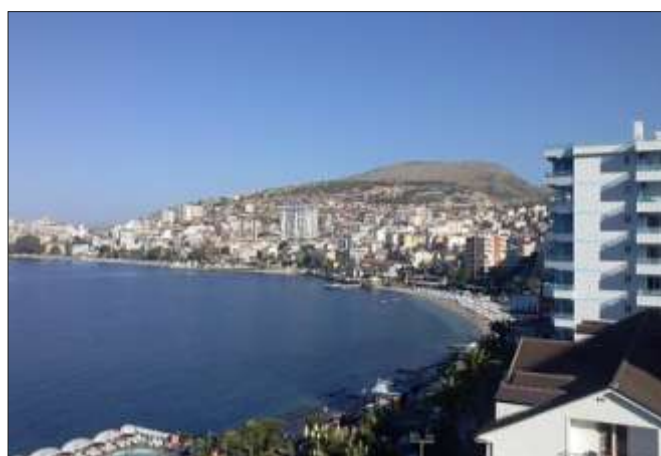
Bild från Albanien