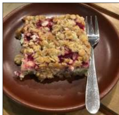
Kaka vid Angla