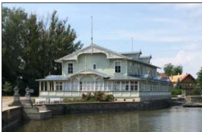
Kursaal i Haapsalu