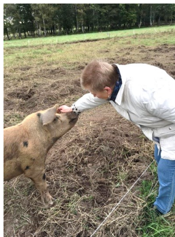
Sörtuna gård