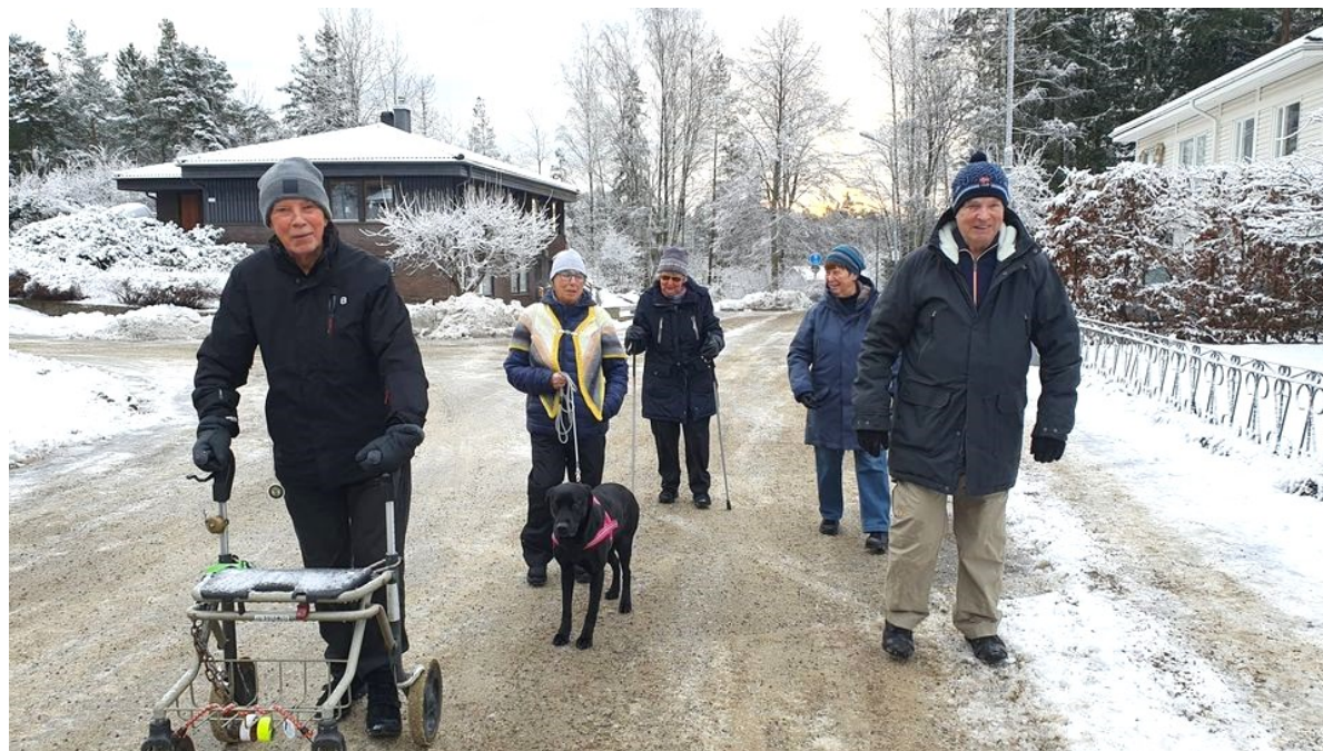
Exempel på kort promenad

Under 2021 har ca 40 sådana promenader genomförts med i medeltal 4 deltagare.