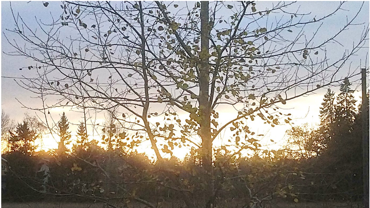
Vinnarbild i senaste fototävlingen

Fototävling har hållits tre gånger under året i samband med utgivningarna av Medlemsbrevet. Tre priser i form av trisslotter har utdelats varje gång och resultatet publicerats i Medlemsbrevet.