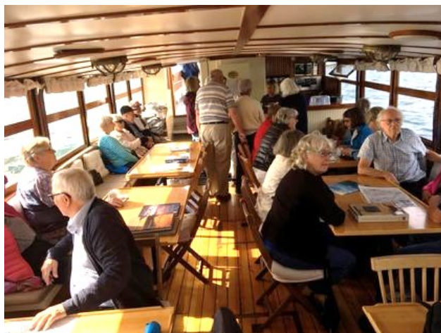
Med M/S Flora till Trosa