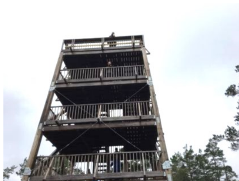
Promenad till Tornberget

Det utökade programmet med längre säsong för kulturpromenader och kulturvandringar har fortsatt under år 2021 och har kunnat genomföras genom att deltagarna hållit avstånd enligt pandemirestriktionerna. Under våren genomfördes alla promenader och vandringar lokalt inom Haninge på grund av restriktionerna, men under hösten har även mål inom Stockholm och grannkommunerna kunnat ingå. Skillnaden mellan promenader och vandringar är att vandringar får vara mer strapatsrika och gå i kuperad terräng. Vid varje promenad har en ledare berättat något om det man ser på vägen. Promenaderna genomförs i lugn takt så att alla hänger med.