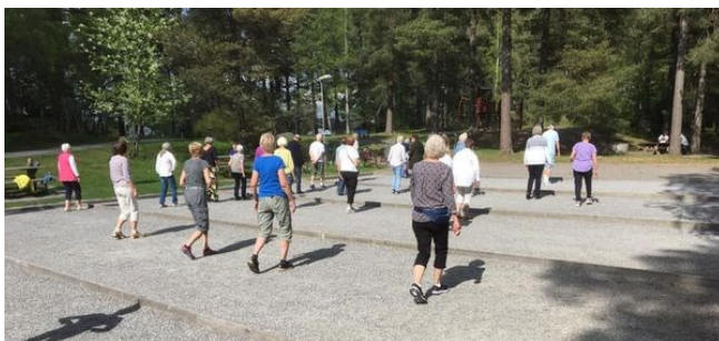
Jerusalemadvans i Evabergsparken

Välbefinnande är ett tema i många av föreningens aktiviteter. Under året har vi haft folkhälsoaktiviteter under SPF Seniorernas folkhälsovecka vecka 20. Det var tipspromenad under vårlunchen i Tyresta by, gökotta och Jerusalemadvans i Evabergsparken. Vi har haft digital och fysisk tisdagsföreläsning om automatisk textning av vardagssamtal. Vi har också haft studiecirkel kring ofrivillig ensamhet som nu väntas fortsätta i praktisk verksamhet.