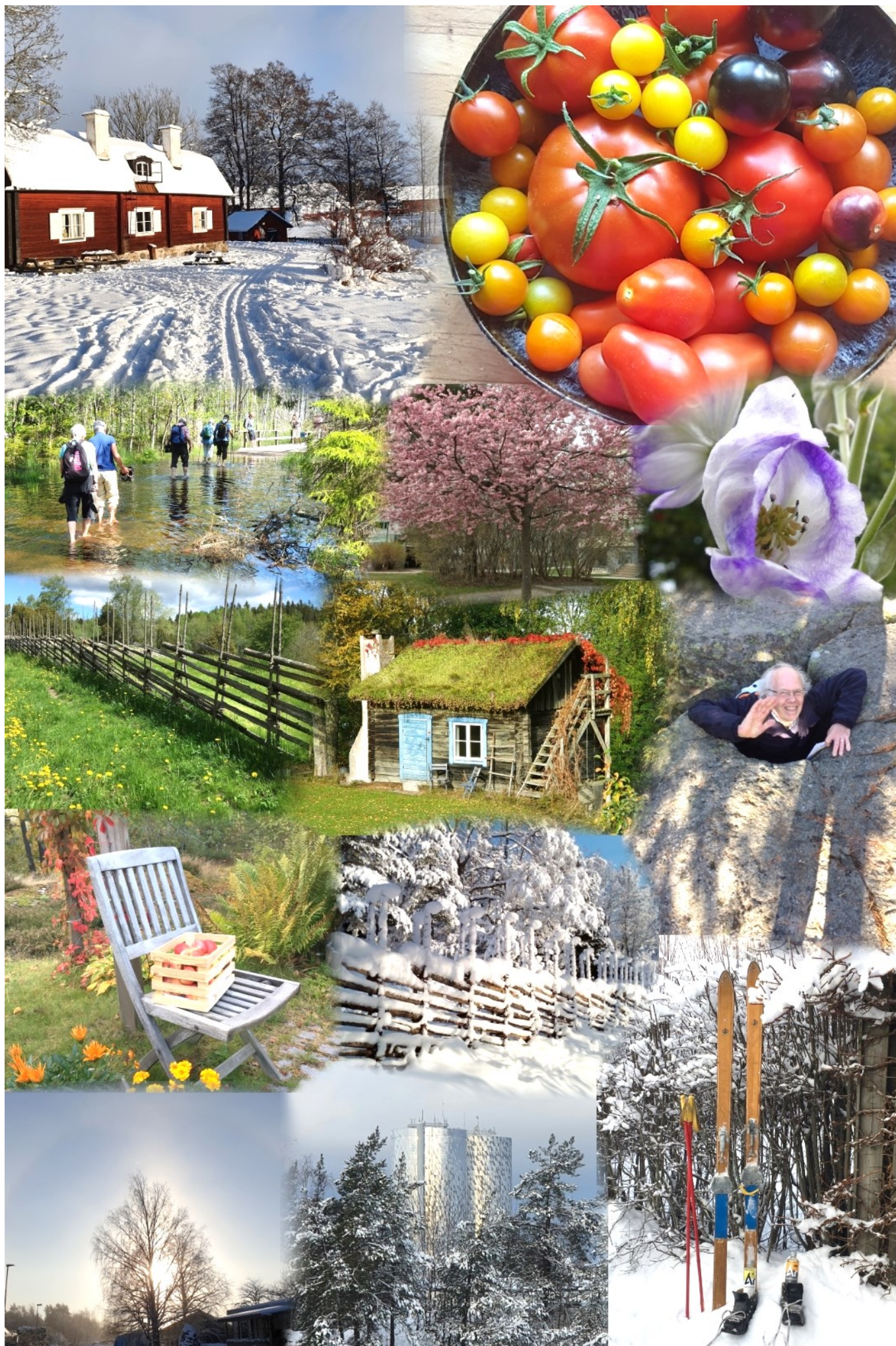
Blandade bilder från våra fototävlingar