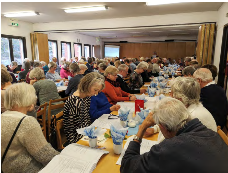
Bild från Årsstämman 2020.