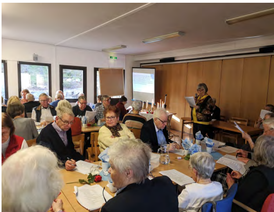
Bild från Årsstämman 2020.