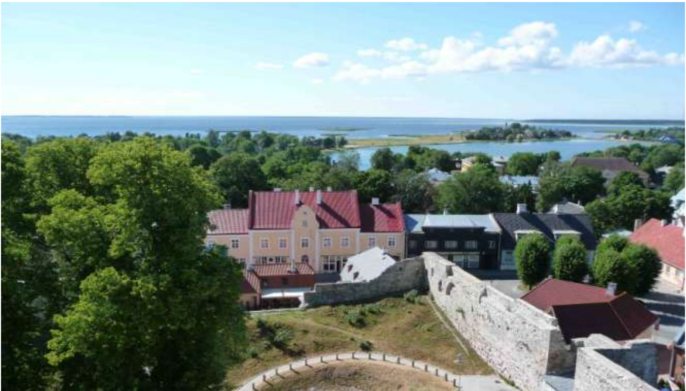
Haapsalu