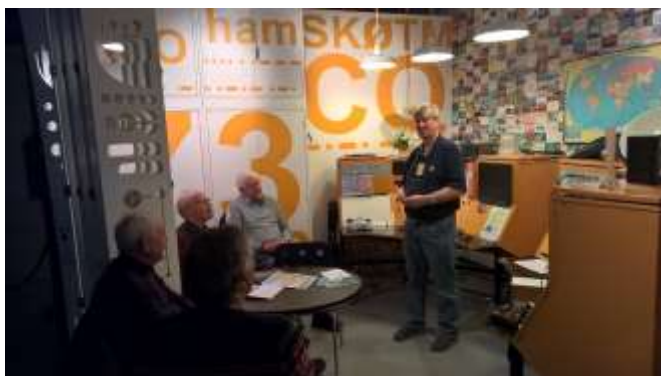
Gubbar besöker Tekniska Muséets Amatörradiostation.