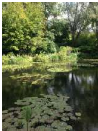
Näckrosor i Giverny