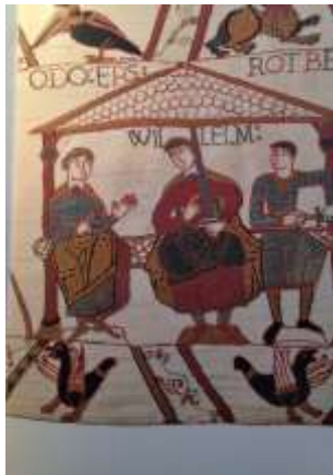
Bayeux tapeten Vilhelm Erövraren