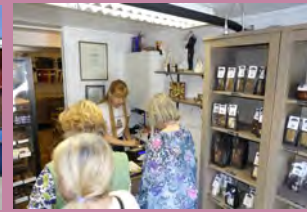
Vårlunchen firades med bl.a. en resa till Ösmo, Häringe och Nynäshamn. Bilder från: Ösmo kyrka, restaurang Kroken och Chokladfabriken i Nynäshamn.