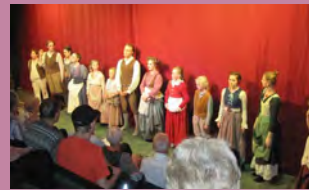
På teatern i Folkets hus fick vi se en trevlig uppsättning av: Råttfångaren i Hamelen, en klassisk historia.