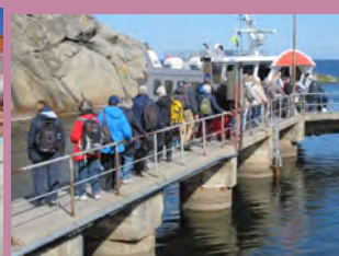
Utflykten till Öja uppskattades av alla bl.a. med besök på Landsorts fågelstation som höjdpunkt. Se mer information plus filmen om Landsort på www.landsort.com