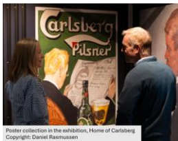
Poster collection in the exhibition, Home of Carlsberg

Rundvandring på Carlsbergs museet i Köpenhamn, härlig "Dansk Frokost" och sedan Karen Blixen museet med en guidad rundvandring. Resan presenterades på månadsträffen 20/11 och programmet skickades ut