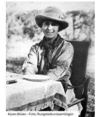
Karen Blixen

Rundvandring på Carlsbergs museet i Köpenhamn, härlig "Dansk Frokost" och sedan Karen Blixen museet med en guidad rundvandring. Resan presenterades på månadsträffen 20/11 och programmet skickades ut