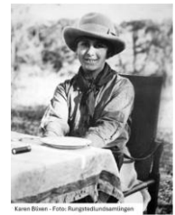
Karen Blixen

Rundvandring på Carlsbergs museet i Köpenhamn, härlig "Dansk Frokost" och sedan Karen Blixen museet med en guidad rundvandring. Resan presenteras på månadsträffen 20/11 och är bokningsbar först då. Resans