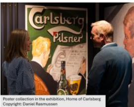
Poster collection in the exhibition, Home of Carlsberg

Rundvandring på Carlsbergs museet i Köpenhamn, härlig "Dansk Frokost" och sedan Karen Blixen museet med en guidad rundvandring. Resan presenteras på månadsträffen 20/11 och är bokningsbar först då. Resans