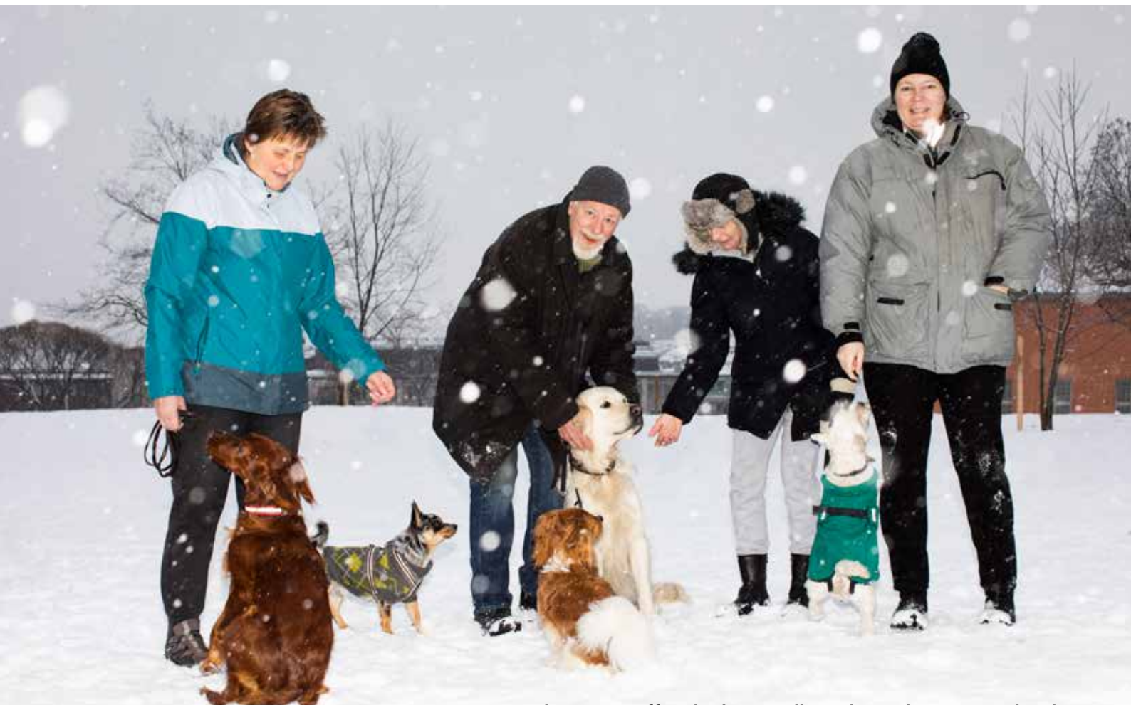
Hundägarna träffas dagligen i alla väder i Observatorielunden.

Jag råder alla att skaffa hund. Den blir som en magnet som drar till sig allt från barn till parkarbetare och annat folk.