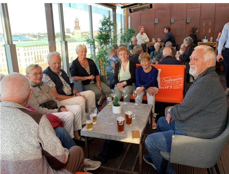
Väl på hotellet igen tog vi oss upp till "Taket" – hotellets takterrass. Där tog vi något att dricka och eftersom ljudnivån var onödigt hög tackade vi för oss och drog oss tillbaka. De flesta var nog trötta efter dagens utflykt.