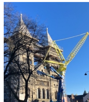
Lund 6 mars 2023