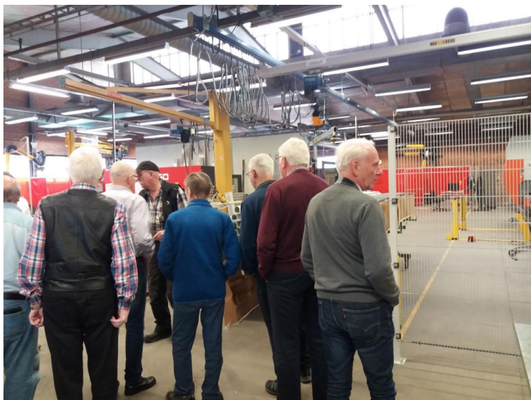
Guidning på verkstadsgolvet.