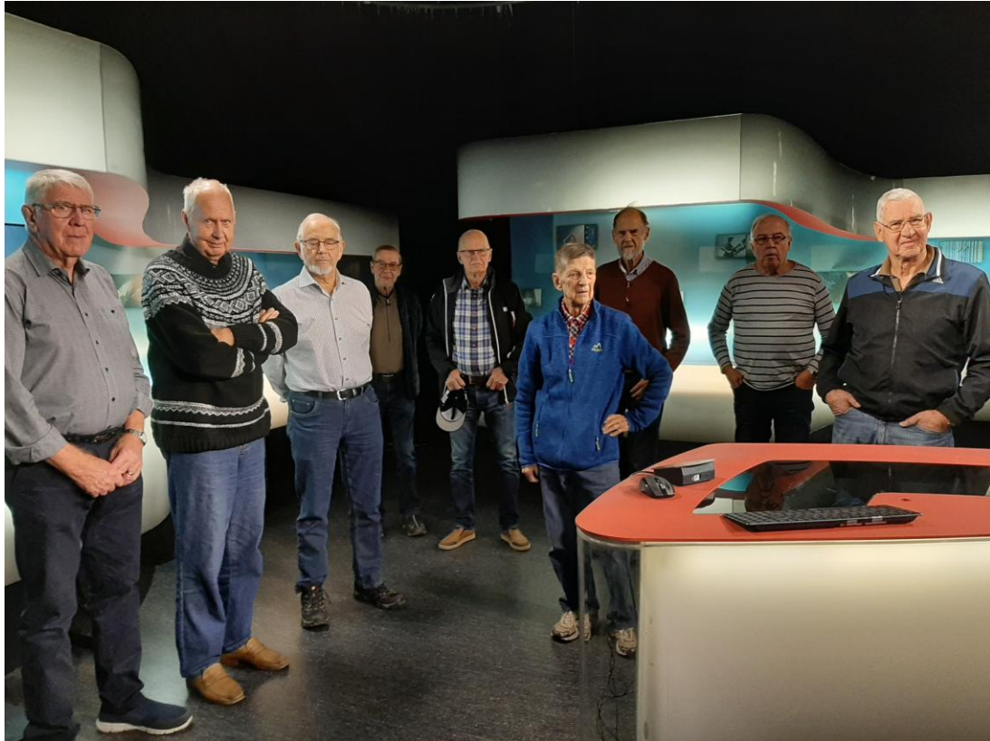
Här ovan är KGK 3 gubbarna samlade i sändningsstudion.