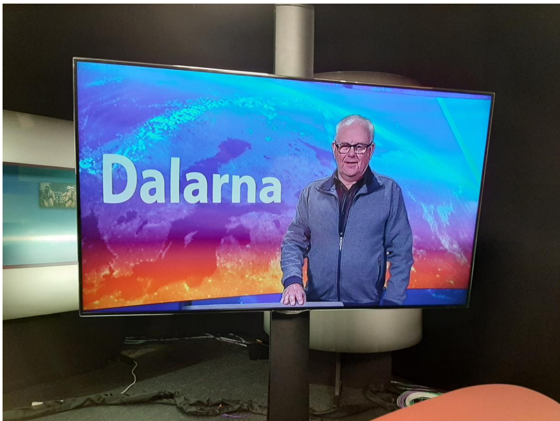
SPF Hedemora har nu fått ett eget nyhetsankare i TV-rutan!!!