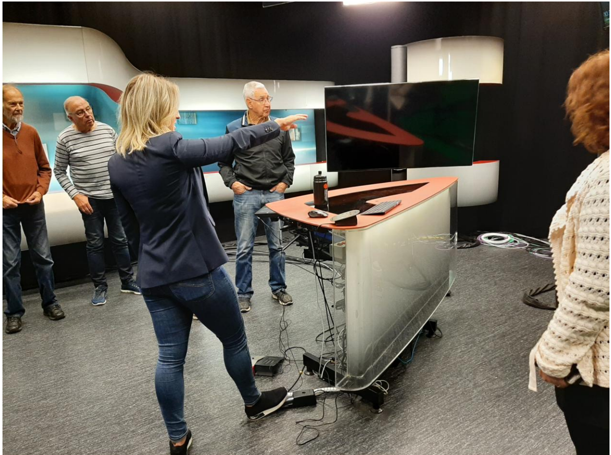
Med ryggen mot fotografens kameran visar här nyhetsuppläsaren hur man "med gaspedalen" får nyhetstexten som läses upp att rulla fram på en bildskärm vid TV-kameran.