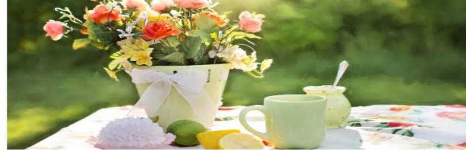
BILDSPEL - SOMMAR