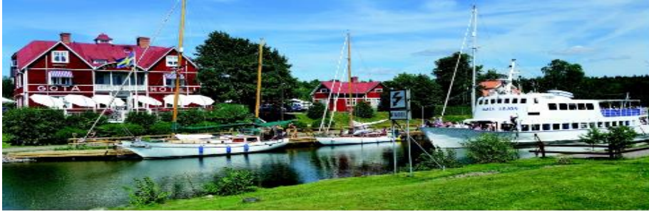
EN RESA LÄNGS GÖTA KANALEN