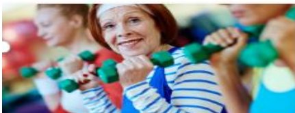
RÖRELSE & DANS