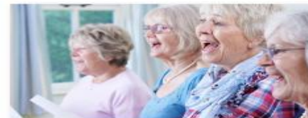
SÅNGER VI MINNS