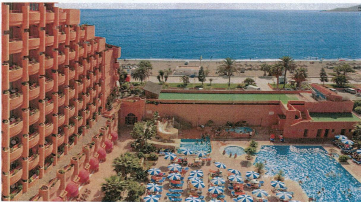
Vårt hotell Almuñecar Playa SPA