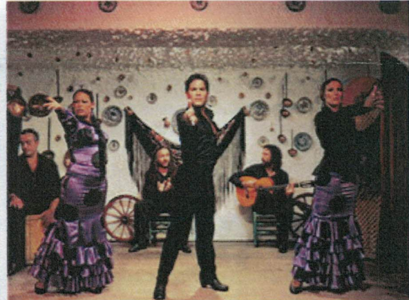
Flamenco Show finns i Almuñecar