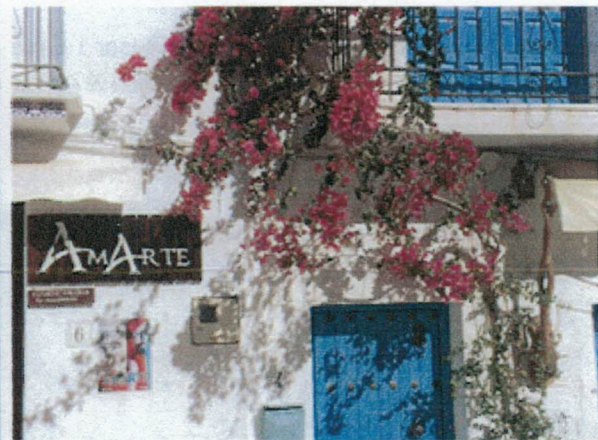
Från Frigiliana – Spaniens vackraste by

Välkommen till vinterns trevligaste flygresa!