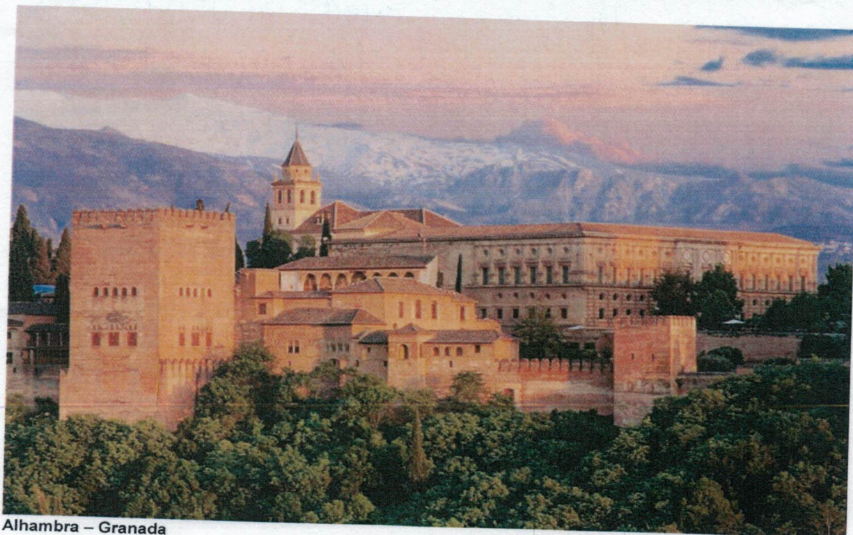
Alhambra – Granada

Den charmiga och vackra staden Granada ligger vid foten av Iberiska halvöns högsta bergskedja Sierra Nevada och är omgiven av skogar som skyddar stadens juvel – det moriska palatset Alhambra! Alhambra byggdes i huvudsak på 1200-talet och är en labyrint av palats, kyrkor, torn, trädgårdar och fontäner. Många av byggnaderna är omsorgsfullt dekorerade med mosaiker, geometriska mönster och sanslöst komplicerade stuckaturer. Detta kan man verkligen kalla för Granadas ögonsten! Som grädde på moset får vi även uppleva det vackra Generalife. Resten av dagen spenderas i Granadas centrum med en liten rundtur och tid till lunch och shopping på egen hand innan återresa.