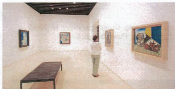
Picassomuséet i Málaga