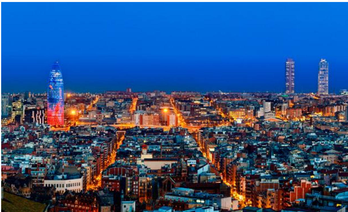
Barcelona by night

Vi välkomnar alla på vår 8-dagars flygresor till Barcelona, Kataloniens huvudstad och Spaniens näst största stad! Boendet är i Malgrat de Mar på den vackra Costa Brava-kusten norr om staden. Barcelona är en världsmetropol som erbjuder det mesta – enastående kultur, otrolig arkitektur, sol, bad, fantastisk gastronomi och självklart fotboll i världsklass. På dagarna strosar man gärna längs stadens mest kända gata La Rambla där det finns både uteserveringar och köpcentrum. Under resans gång får vi även lära känna Barcelonas omgivning och den vackra kusten norr om staden. Vi bor i Malgrat de Mar som är en av Costa Bravas många trevliga badorter. Hjärtligt välkomna till en härlig sensommarresa!