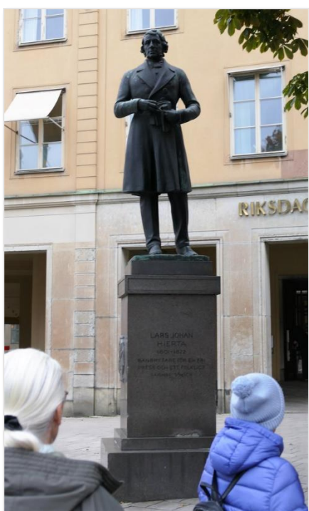
Lars Johan Hierta var tidningsman, bokförläggare, företagare och politiker. Bland annat grundade han tidningen Aftonbladet 1830.

Idag är den stensatta gården framför trappan upp till Bondeska palatset begravad under plattorna som täcker HD:s gård. Innan markerade en blankare kullersten platsen där Fersen mördades. Trots olika omläggningar innan påstods stenen (oförklarligt) alltid ha återfunnits på samma plats. Idag går stenen dock inte att hitta.