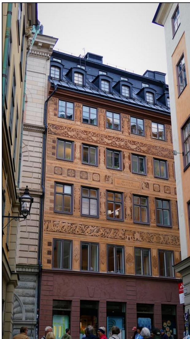
Vacker fasad på Västerlånggatan 3.