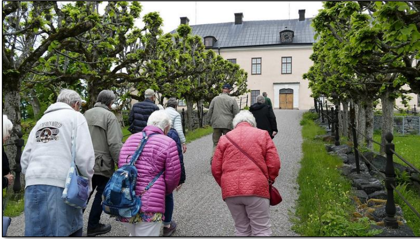
Slottet var en gång i tiden försett med tinnar och torn.