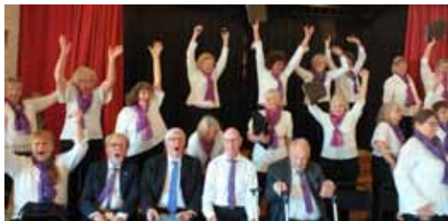
Vi är så glada. Idag för det är vår sångardag!

Du vill väl vara med? Du är välkommen att komma och pröva. Vad krävs? Sångarglädje, samt viss kunskap i notläsning.