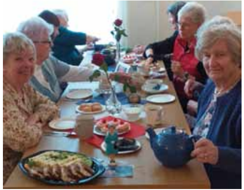
Afternoon tea. Bordet är dukat, gästerna är på plats.