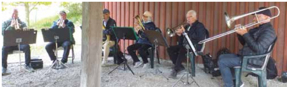
Huddinge Messing blås invigde våra uteaktiviteter på Sundby Gård.