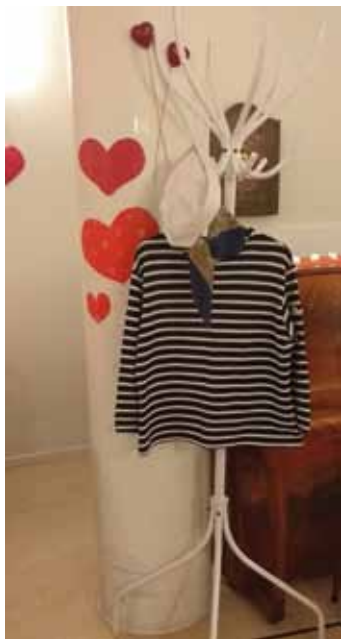
På kryss med Alla Hjärtan. Det fanns plats för en till i besättningen.