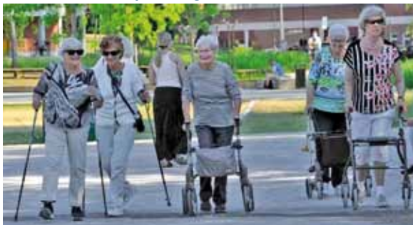
till Allsångskonsert i Sjödalsparken